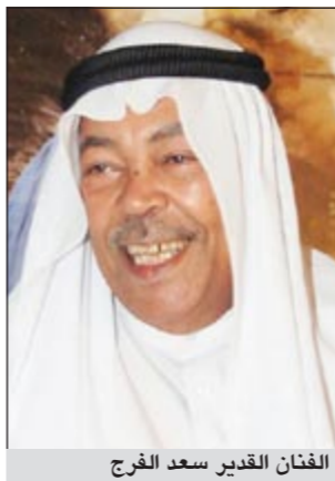
الفنان القدير سعد الفرغ

وأضاف قائلا: لم يكن «تورا بورا» تكبره ممن الأفلام التي تحاكي الدين والسياسة، والإرهاب في الوقت ذاته، إذ احتاج تحديد مواقع التصوير واختيارها وقتا طويلا، ووقع الاختيار أخيرا على أرض المغرب العربي في هوليود والمغرب، بلدة ورزازات، التي كانت أرضا خصبة لأفلام هوليوودية كثيرة حققت نجاحات كبيرة. أما عن الكوادر التي عملت على إدارة تفاصيل التمثيل، مثل التصوير والإنتاج، وما إلى ذلك من عمليات أخرى أسهمت في انجاح العمل السينمائي الضخم، فلقت العوضي السى ان عددا ليس بقليل من الممثلين ساعد