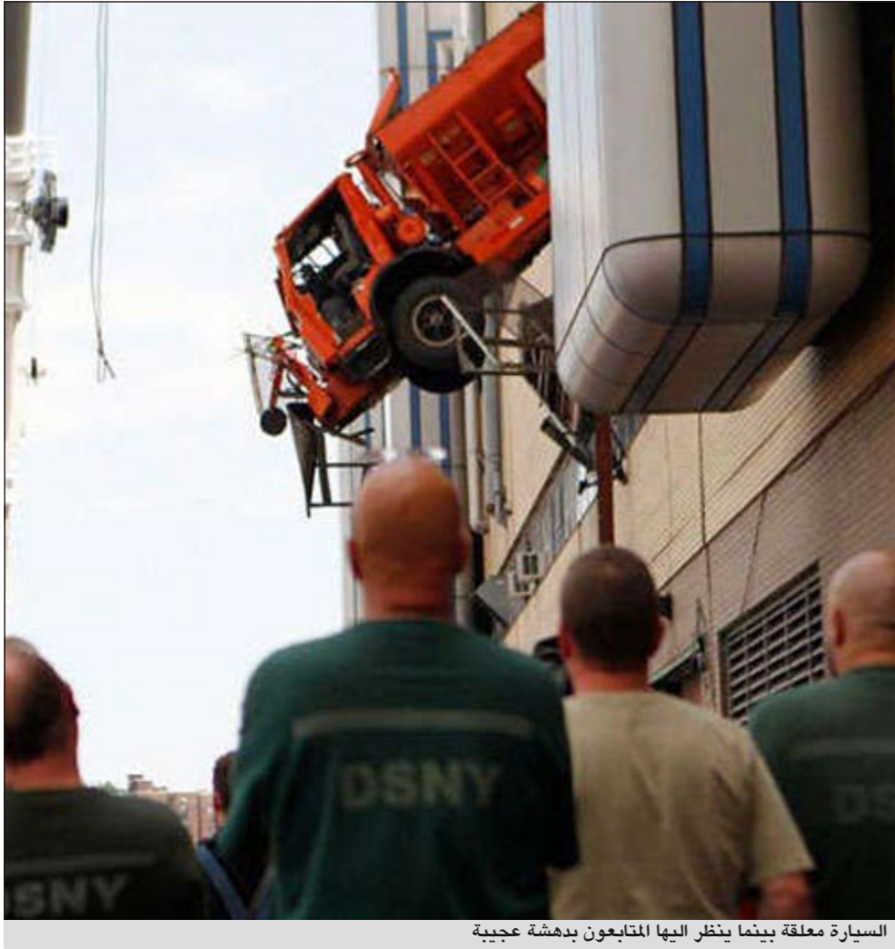
السيارة معلقة بينما ينظر إليها المتابعون بدهشة عجيبة

نيويورك - وكالات: اخترق سائق شاحنة جدار الطابق الثاني لأحد مراكز الإصلاح الواقعة في مدينة نيويورك، وكادت تسقط الشاحنة بالكامل من الجدار قبل أن يتعلق الجزء الخلفي منها بالحائط، ليستطيع رجال الإطفاء إنقاذ السائق عن طريق السلالم في منظر من النادر أن نراه مرة أخرى للسيارة والسائق الذي يبلغ من العمر 56 عاما، وفقا لما ذكرته صحيفة «ذي صن» البريطانية.