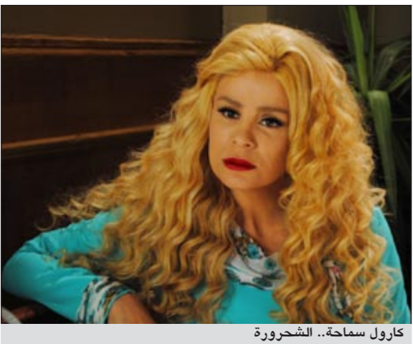
كارول سباحة.. الشحرورة

بها الاتفاق ما أدى إلى فصل موضوعي بين ملاحظات صباح والملاحظات التي انطلقت من جانب الفنانة فيروز، فتم بذلك الالتفاف على احتجاج صباح بالتحديد بما أنها المعنية أولا وأخيرا بالمسلسل، وباتت بقية الاحتجاجات لا قيمة لها.