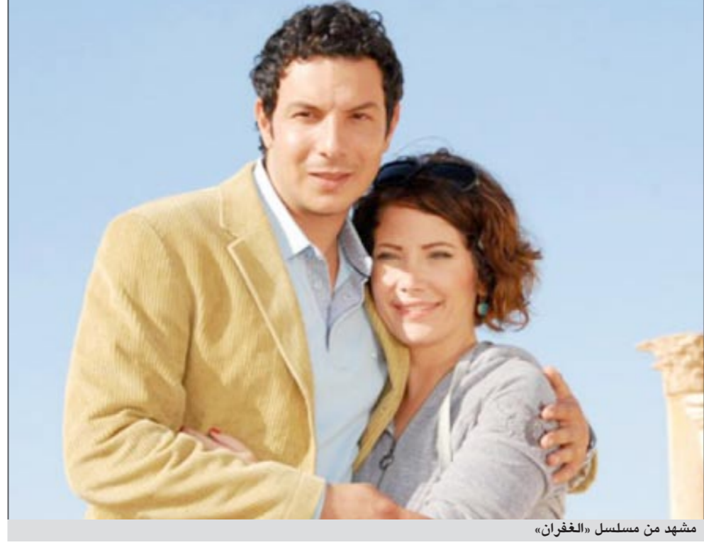
مشهد من مسلسل «الغفران»

قلة هم المخرجون الذين تشكلت أسماؤهم دافعا رئيسيا لمشاهدة أعمالهم، ويأتي المخرج السوري القدير حاتم علي ضمن أبرز هؤلاء، وذلك لإبداعاته السابقة التي حققت جماهيرية طاغية كـ «عصي الدمع»، و«التغريبة الفلسطينية» و«ثلاثية الإندلس» وغيرها العديد من الأعمال الناجحة. بناء على ذلك تابعنا مسلسل «الغفران» مع بداية الشهر الفضيل بحماسة لرؤية عودة المخرج حاتم علي للأعمال الاجتماعية بعد انتحاره في السنتين الأخيرتين للأعمال البدوية، فمأذا كانت النتيجة بعد عرض أكثر من نصف حلقات العمل.