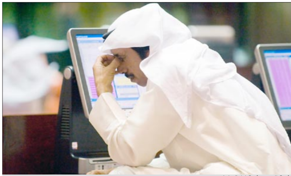
أزمة الكويت أزمة إدارة عليا

ما لا نستطيع ان نفهمه لا علاقة له بأي فريق، او ما يخرج عنه من تقارير، وتوصيات، وهو اصطدام هذه التوصيات بسور الصبن، عندما تصل إلى مرحلة التنفيذ، فلا قدرة ولا رغبة سياسية في لوج طريق الاصلاح والبناء، ذلك يعني ان صلب الأزمة ليس في الرؤى، ولا في الموارد البشرية وغيرها، ولكنها أزمة ادارة عليا ونرجو الا يطول الوقت للاعتراف بها، عدا ذلك حتى هذا الفريق الطيب سيمثل مرحلة الاحتياط، وهو طريق بلغته الكثيرون قبلهم، لذلك نرجو الحفاظ على ما تبقى من أمل ومن بشر مقاتلين لديهم بعض منه، واتخاذ قرارات كبيرة ومستحقة بشأن تغييرات الإدارة ونهجا ومحتوى.