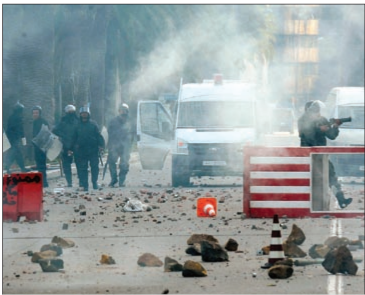
قوات الأمن فشلت في لحجم الثوار