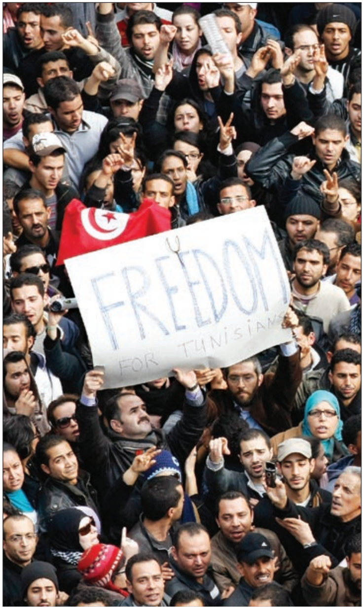
الحرية.. شعار الثوار