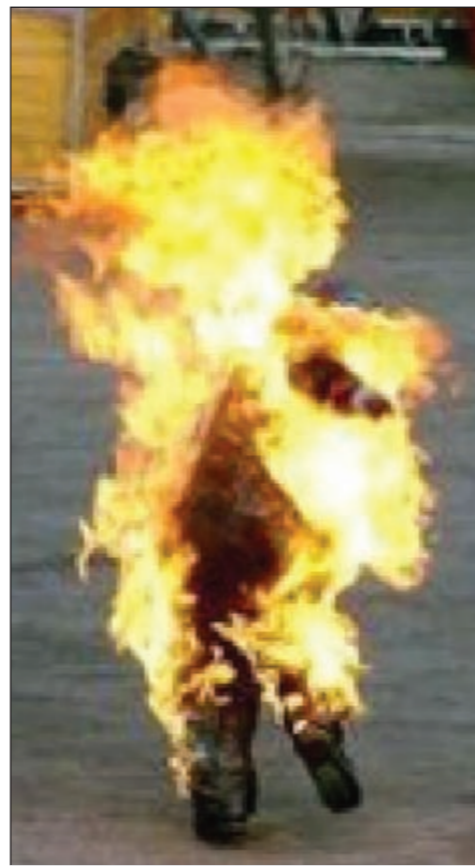
.. صورة البوعزيزي بعد اضرام النار بنفسه