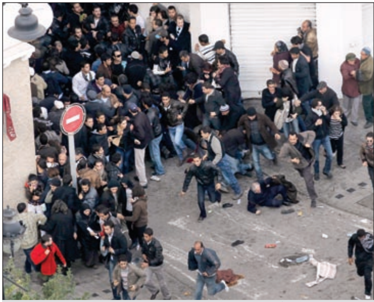
مواجهات مع قوات الأمن