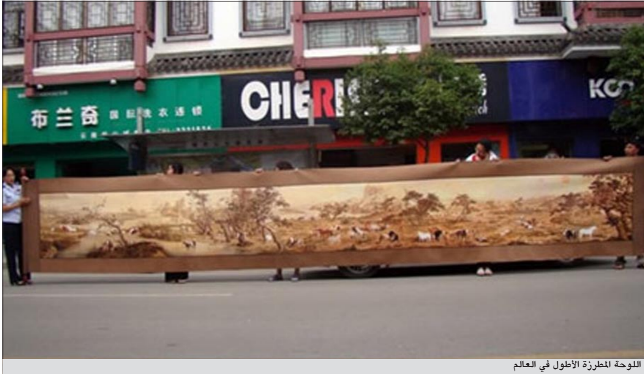
اللوحة المطرزة الأطول في العالم

ويوم السبت الماضي اصطحب فريكير حبيبته إلى مطعم وقال لها إنها سيحضران حفلة تقاعد غير أنه ما لبث أن ركع على ركبتيه وطلب منها للزواج وقبلت بذلك. وحين دخلت المطعم رأت أن 207 أشخاص من الأقارب والأصدقاء قد احتشدوا في الداخل مع الزينة والأزهار وأحضر لها عدة المكيح وفستان الزفاف الذي كانت قد اشترته مؤخرا.