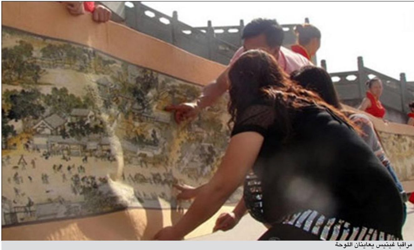
مراقبا غينيس يعاينان اللوحة

دخلت قطعة فنية من التطريز موسوعة غينيس القياسية العالمي، ويتعدى طولها 25 مترا على 0,96 سم حيث استخدمت