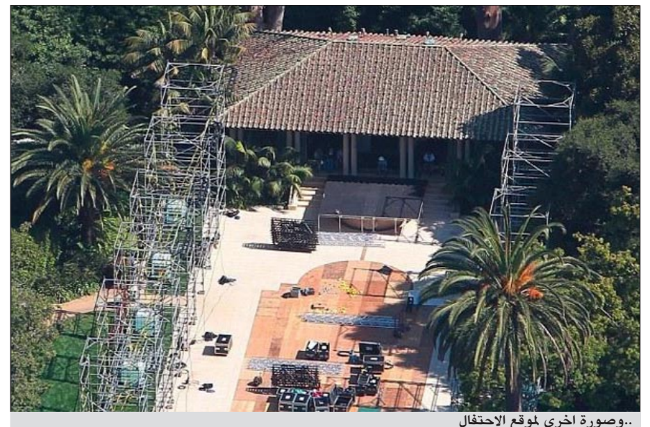
..صورة اخرى لموقع الاحتفال