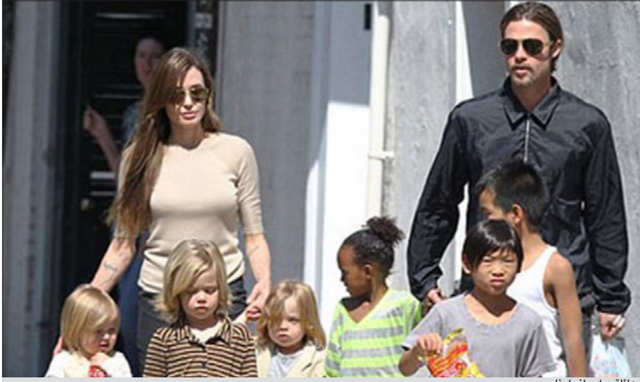
عائلة براد وأنجلينا

وعرف الركاب بعد ذلك أن براد وأنجلينا استأجرا قطاراً كاملاً لاستخدامه في الانتقال مع أطفالهما. واستغرقت الرحلة خمس ساعات قطع القطار خلالها 550 كيلومتراً. لكن شركة «فيرجن ترينس» التي قامت بتأجير القطار لتجمي هوليوود رفضت الكشف عن الثمن الذي حصلت عليه مقابل هذه الخدمة الاستثنائية. ويقدم براد وأنجلينا وأطفالهما حالياً في لندن لالتزامهما بأعمال تصوير. وعندما ترغب أنجلينا في الذهاب إلى مركز المدينة للتسوق فهي لا تستقل عادة السيارة وإنما تستخدم المروحية للتنقل.