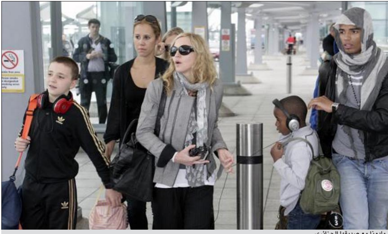
مادونا مع صديقتها الجزائري

بعنوان «فتاة مادية». وفي إحدى المقابلات الإعلامية قال زابيات عن مادونا: «إنها امرأة مثل كل النساء. بالطبع هي فتاة غير عادية ومشهورة عالمية، لكنها في النهاية امرأة». وكانت انتشرت شائعات في يونيو الماضي حول انفصالها لفترة قصيرة. وتعمل مادونا حالياً على كتابة البومها الغنائي الجديد.