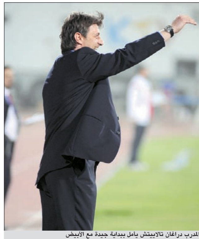
المدرب دراغان تالاييتش يأمل بداية جيدة مع الأبيض

ويسعى الكويت للدفاع عن لقبه في النسخة الماضية عندما يلتقي الفحيحيل اليوم وتبدو كفة الأبيض الأرجح بالقياس إلى الفوارق الفنية والبدنية بين اللاعبين وهي المهمة الرسمية الأولى للمدرب الكرواتي دراغان تالاييتش، والمحترفون الجدد العاجي بوريس كابي والمالي