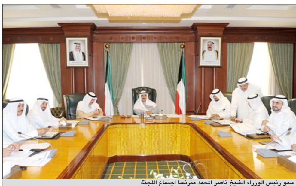
سمو رئيس الوزراء الشيخ ناصر المحمد مترئسا اجتماع اللجنة

تعرض طرح باقي الشركات بالتنسيق والتعاون بين جميع الجهات ذات الصلة.