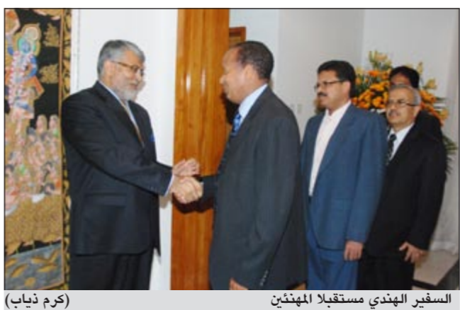
السفير الهندي مستقبلاً المهنيين

شدد السفير الهندي ساتيش مهتا على قوة وعمق العلاقات التي تربط الكويت بالهند، مشيراً إلى أنها علاقات ممتازة ووجوده في الكويت من أجل الحفاظ على هذه العلاقة وتقويتها. وقال ساتيش خلال حفل الإفطار الذي نظمته السفارة الهندية مساء