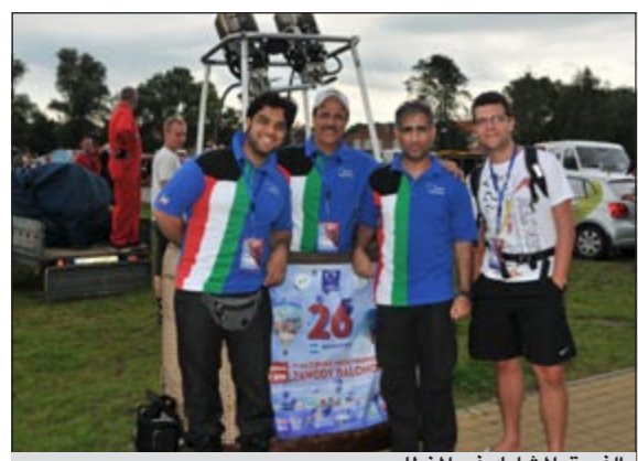
الفريق المشارك في المنطاد

برلين - كونا: بدأ فريق «منطاد الشكر» الكويتي جولته في بولندا التي تأتي ضمن الاهتمام الكبير للكويت بتقديم الشكر لجمهورية بولندا الصديقة على مواقفها المسؤولة من احتلال الكويت قبل 20 عاماً.