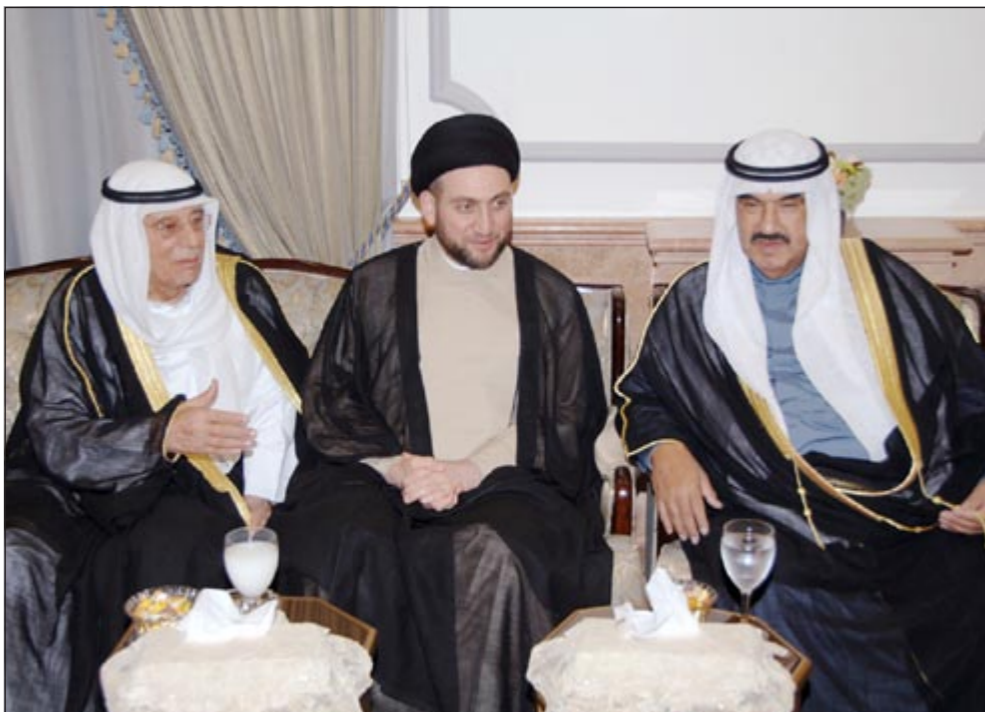
سمو رئيس الوزراء الشيخ ناصر المحمد وعمار الحكيم خلال الغيبة