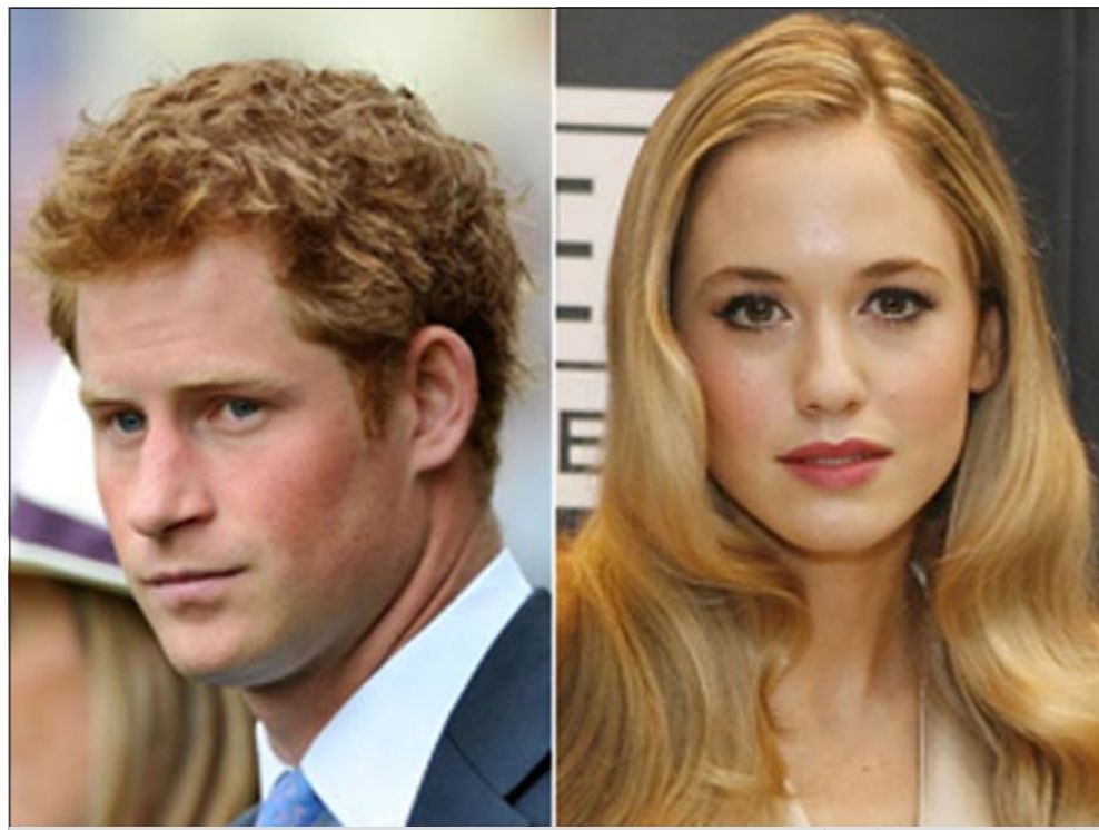
الأمير هاري وعارضة الأزياء فلورانس برودينيل

وبالبالغ سعرها 2,5 مليون جنيه استرليني. وراجت شائعات عن علاقة غرامية بين هاري وبيبا ميدلتون شقيقة زوجة أخيه سرا فلورانس العشيقة السابقة لبطل سباقات السيارات البريطاني جينسون باتون وأضيا وقتاً حميماً معا بشقتها بمنطقة نوتنغ هيل غرب لندن