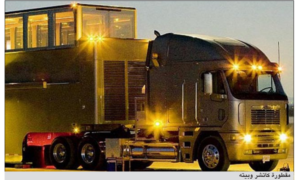
مقطورة كاتشر وبيته

دبي - إم.بي.سي: يعيش الممثل الأمريكي آستون كاتشر حاليا داخل مقطورة متنقلة عبارة عن «عقار متنقل»، يتضمن شتى وسائل وتسهيلات الحياة المعاصرة، كي يتمكن النجم من التركيز على مهمته في تصوير 26 حلقة من المسلسل الكوميدي «Two and a half men». وأوردت تقارير إعلامية أن زوج الممثلة ديمي مور سيتقاضي مليوني دولار عن كل حلقة يشارك فيها. ويبلغ وزن المقطورة نحو 30 طنا، في حين أنها تتكون من طابقين يمكن أن يصبحا طابقا واحدا عند القيادة. تبلغ مساحتها نحو 1100 قدم مربعة، وتحتوي على شاشة تلفاز بلازما بحجم 60 أنشئا وغرفة معيشة وحمامين ومطبخ مغلي ببلاط الجرانيت، إضافة إلى غرفة اجتماعات. ومن النجوم الذين سكنوا هذه المقطورات الفاخرة المغنية ماريا كاري وشارون استون وفان ديزل وغيرهم كثير. وأوضح مصمم المقطورة رون أندرسون لصحيفة «دايلي ميل» البريطانية أنه يتم إنتاجها خصيصا للنجوم، مشيرا إلى أن قيمة إيجارها أسبوعيا تبلغ 8750 دولارا. ويحيط بالمقطورة نظام كاميرات مراقبة، وعند دق الجرس ينخفض صوت التلفاز ومكبرات الصوت مباشرة، كما تظهر على التلفاز صورة الضيف الواقف خارجا. وكان ويل سميث نزل في مقطورة مشابهة عند تصوير فيلم «3Men In Black»، مطالبا بتعديلات طفيفة، كإضافة غرفة لعب لأطفاله وغرفة للعب الشطرنج وغرفة لهندسة الصوت. وقال أندرسون: إنه يملك حاليا 4 مقطورات مشابهة يتم تاجيرها دوريا، وأنه باع 9 فقط لمن وصفهم «بأثري أثرياء العالم» والمقابل مليونًا دولار فقط.