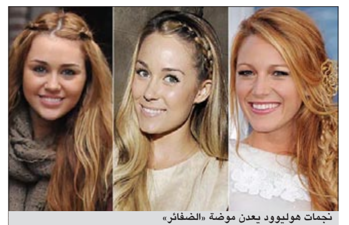
نجمات هوليوود يعدن موضة «الصفائر»

دبي - إم.بي.سي: أعادت نجما هوليوود، ومن بينهن نيكول كيدمان، ومايلي سايرس، موضة «الصفائر» التي كانت تعبر عن حصرها على الفتيات الصغيرات، ولطالما ارتبطت هذه التسريحة بتلميذات المدارس، إذ تعتبر تسريحة عملية، ترفع الشعر عن الوجه ليبقى مرتبا طوال النهار. كما أنها تسريحة مناسبة جدا في أيام الحر، إذ تبعد الشعر عن الرقبة والاكتشاف، وتحديدا في المناطق التي تعاني من رطوبة عالية. إلا أن نجمات هوليوود - وكعادتهن دائما - أضفن لمساتهن الخاصة إليها، كل على طريقتهن وبألوانها وتوقيعها الخاص، فكانت إما جانبية، أو خلفية، أو مبعثرة لتعطي طلة أكثر طبيعية، أو فنانية، أو حتى تتضمن قماشية متناسقة مع ملابسها، وغيرها كثير، كما ستظهر الصور أدناه. وتعطي الجدائل أو الصفائر انطباعا بأن صاحبتها أصغر سنًا مما هي عليه حقا، ويمكن تقسيم الشعر إلى قسمين وتسريح ضفيرتين، أو يمكن فرد نصف الشعر وتسريح النصف الآخر. ولعل أشهر من اعتمدت الصفائر الممثلة الأسترالية نيكول كيدمان، والمغنية ريهانا، ومايلي سايرس، واليشا كيز، وغيرهن كثير.