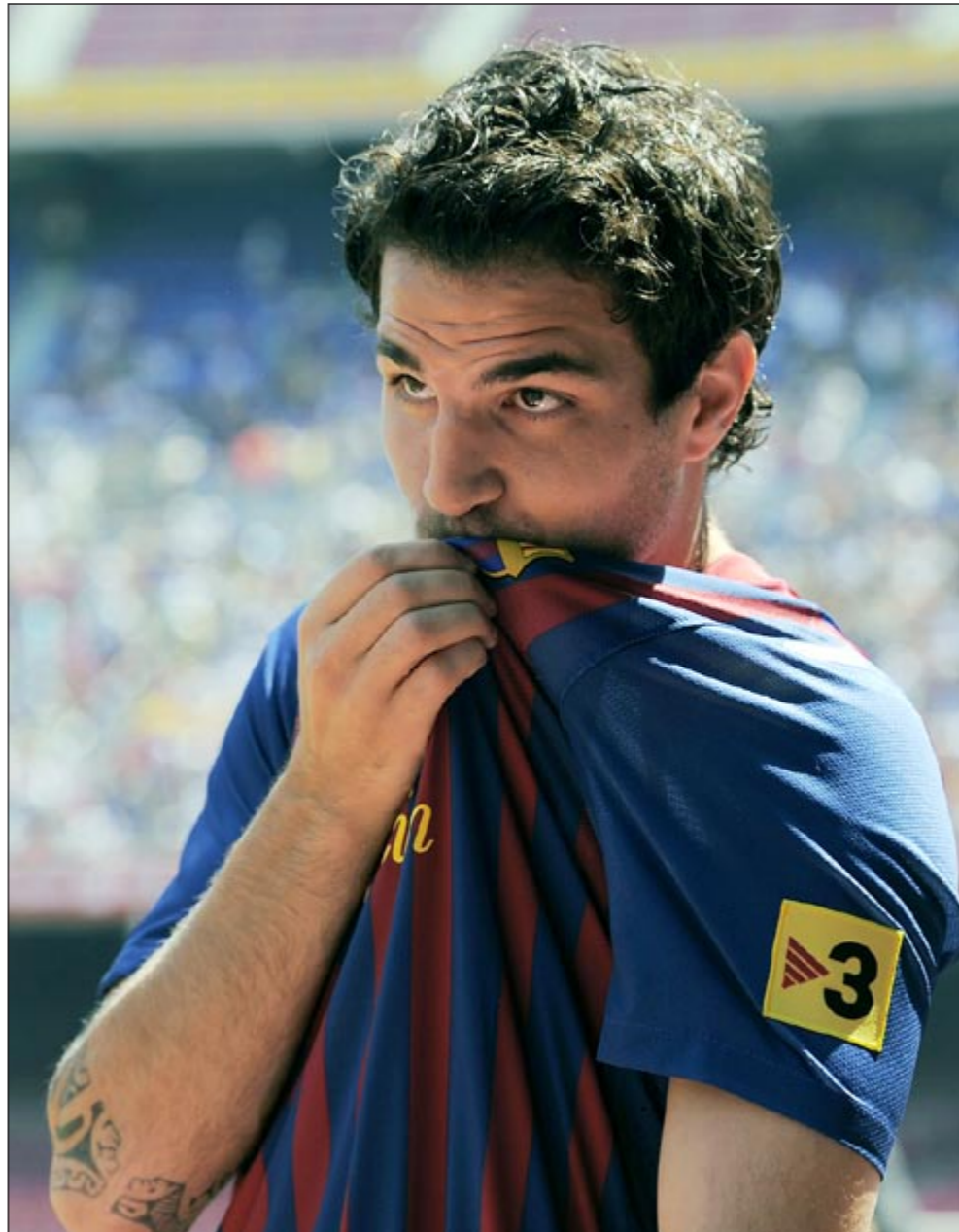
نجم برشلونة الجديد سيسك فابريغاس يقبل شعار «كاتالونيا»

فتح مكتب الاتحاد الفيديرالي الأمريكي تحقيقاً بعد أن تلقى وثائق سرية تفيد بتحويل مبالغ إلى حساب مالي خارجي يعود إلى عضو اللجنة التنفيذية في الاتحاد الدولي لكرة القدم «فيفا» الأميركي تشاك بلايزر. وكشفت صحيفة «دي اندبندنت» الإنجليزية بان مسؤولين في مكتب التحقيق الفيديرالي يحققون في تحويلات مالية تلقاها بلايزر في حسابه المصرفي في جزر كايمان والباهاماس من قبل اتحاد الكونكاكاف. وتتركز التحقيقات على مبلغ مقداره 250 ألف دولار حصل عليه بلايزر في مارس الماضي، وقد اعتبر الأخير بأن هذا المبلغ هو إعادة تسديد قرض شخصي قام به إلى رئيس اتحاد الكونكاكاف السابق الترينيدادي جاك وارنر قبل أن يعترف بأن الأخير قد يكون اساء استعمال خزائن الاتحاد القاري، وبأنه أي بلايزر مستعد لإعادة هذا المبلغ إذا كان هذا الأمر صحيحاً. وذكرت الصحيفة أيضاً أن بلايزر وافق