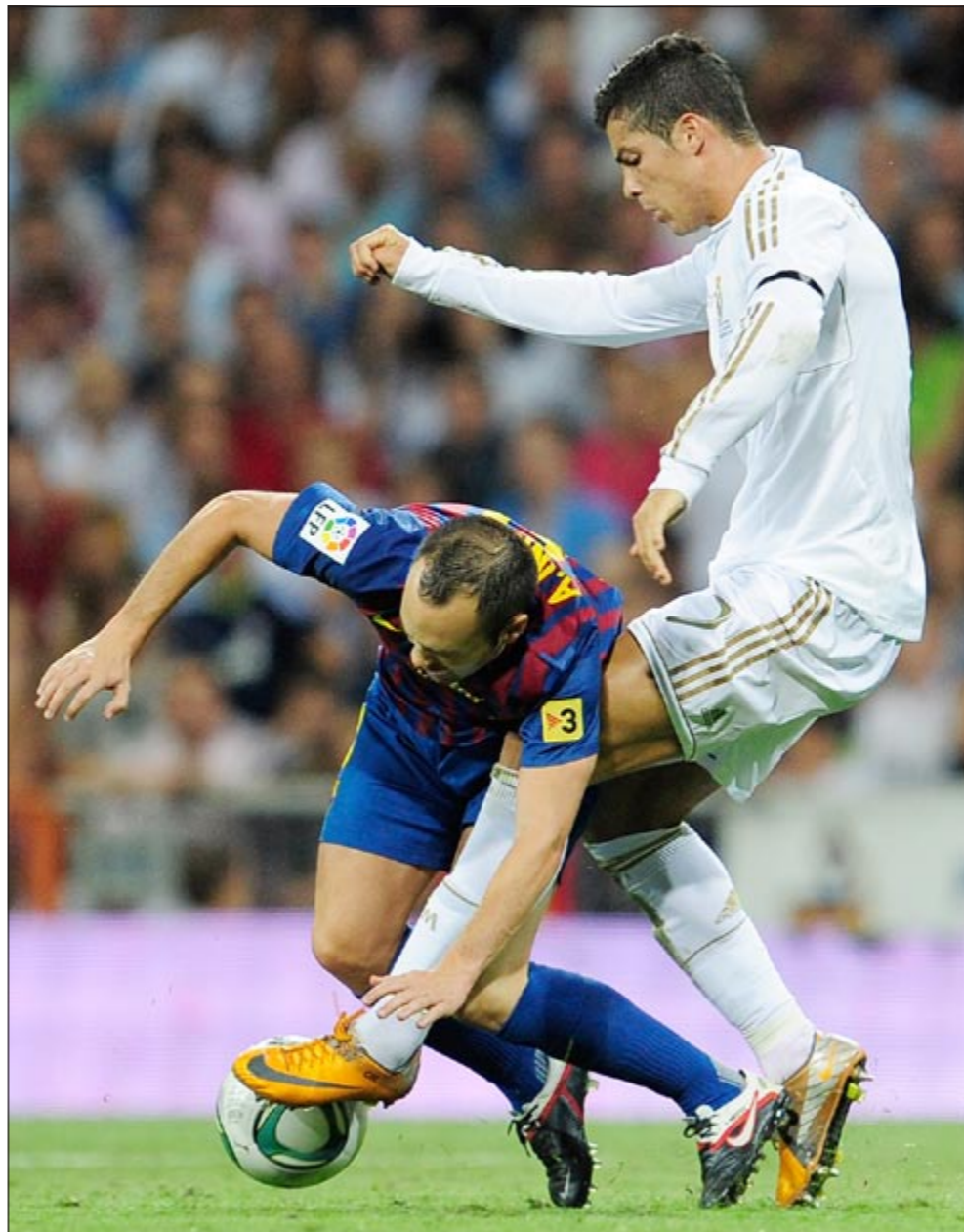
نجم ريال مدريد كريستيانو رونالدو يتخطى اندريس انيستا

تتجدد المواجهة بين الغريمين التقليديين برشلونة وريال مدريد في إياب الكأس السوبر الإسبانية لكرة القدم، اليوم الأربعاء على ملعب «كامب نو» في برشلونة، بعد انتهاء مباراة الذهاب المثيرة بالتعادل 2-2 يوم الأحد الماضي في مدريد. وستركز الأنظار على لاعب برشلونة الجديد القديم سيسك فابريغاس المنتقل حديثاً من أرسنال الإنجليزي بعد صفقة أحدثت جدلاً كبيراً في عالم الانتقالات، نظراً لإصرار اللاعب على الانتقال «فقط» إلى برشلونة.