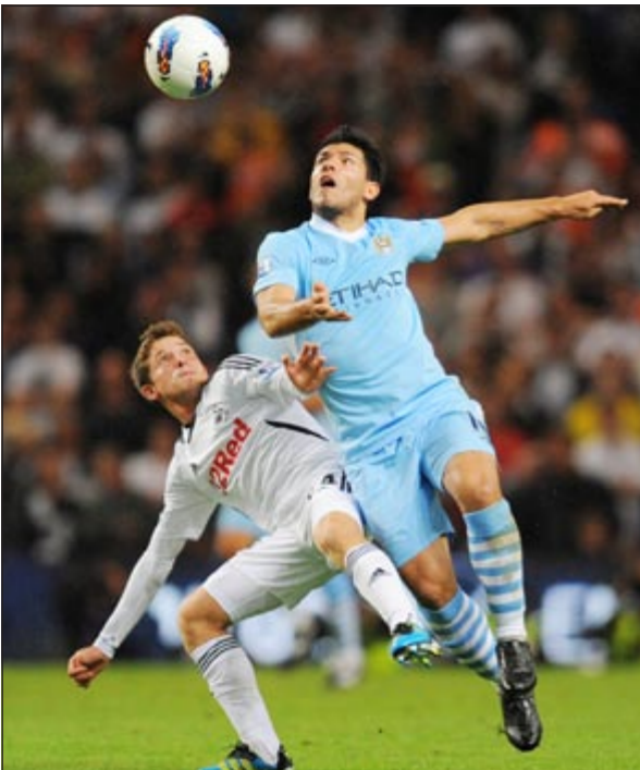
الأرجنتيني سيرجيو أغويرو يتربص الكرة مع جوي الن

استهل فريق مانشستر سيتي مشواره في الدوري الإنجليزي الممتاز لكرة القدم بفوز كبير على سوانزي سيتي بأربعة أهداف نظيفة في المباراة التي أقيمت بينهما مساء الإثنين على ملعب «ستي أوف مانشستر ستديوم»، وذلك في ختام مباريات الأسبوع الأول للبطولة. ويعود الفضل لفوز السيتي الكبير على سوانزي إلى الواصل الجديد للفريق الأرجنتيني سيرجيو أغويرو المنتقل حديثاً للفريق الأزرق من صفوف أتلينكو مدريد الإسباني بعد تسجيله هدفين فسي أول ظهور له مع سيتي. وافتتح المهاجم البوسني «أدين دزيكو»، التسجيل لمان سيتي في الدقيقة 13 من زمن الشوط الثاني، وأضاف أغويرو الهدف الثاني في الدقيقة 23، ثم جاء سيتي قبل إقفال باب الانتقالات الصيفية في 31 أغسطس الجاري أم لا.