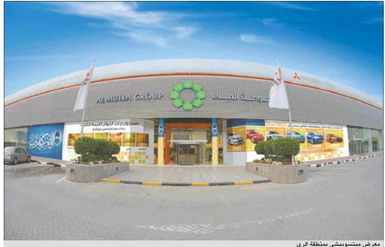
معرض ميتسوبيشي بمنطقة الري

احتفالاً بحلول شهر رمضان المبارك وفي إطار سعيها الدائم للتواصل مع عملائها وكعادة كل عام، أعلنت مجموعة الملا، الوكلاء الحصريين لسيارات ميتسوبيشي في الكويت، عن إطلاقها لأحدث العروض التسويقية السخية وأقواها في سوق السيارات المحلي، لتمتد عملاءها من شراء أحدث سيارات ميتسوبيشي بأسعار غير مسبوقه ومزايا عديدة مع الحصول على جوائز قيمة، لتبقى تجربة اقتناء إحدى سيارات ميتسوبيشي خلال الشهر الفضيل تجربة فريدة مميزة تبقى محفورة وراسخة بذاكرة العملاء.