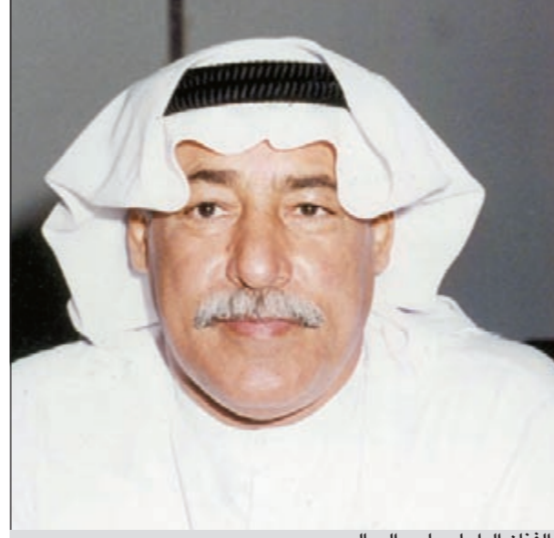
الفنان الراحل جاسم الصالح

العلاقات الإنسانية تتعرض للعديد من المواقف منها مضحك ومنها مبيك في هذه الزاوية نسلط الضوء على شخص فقدته وكانت تجمعك به علاقة إنسانية جميلة وتتمنى حالياً رؤيته.