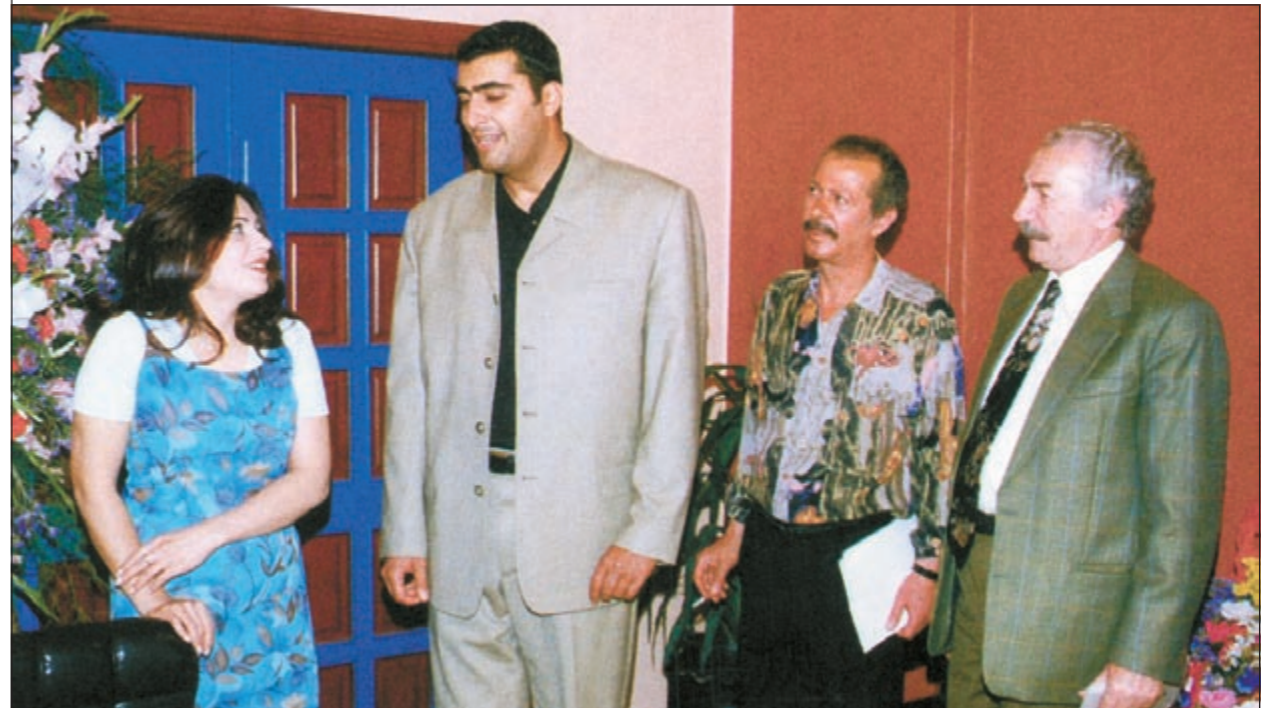
في أحد أعمالها التلفزيونية