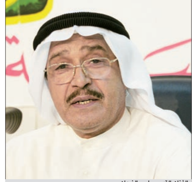
الفنان القدير جاسم النبهان