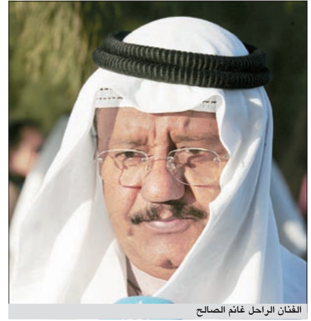
الفنان الراحل غانم الصالح