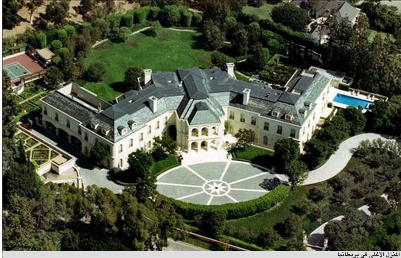
المنزل الأعلى في بريطانيا

يشار إلى ن والدة النجم الراحل كاترين جاكسون تسعى شخصيا إلى إقناع باقة من نجوم العالم لأداء أغان في حفل تكريم ابنها الذي يقام في ويلز في أكتوبر المقبل بينهم جاي زي وكريستينا أغيليرا وجاستين بيبر وغيرهم.