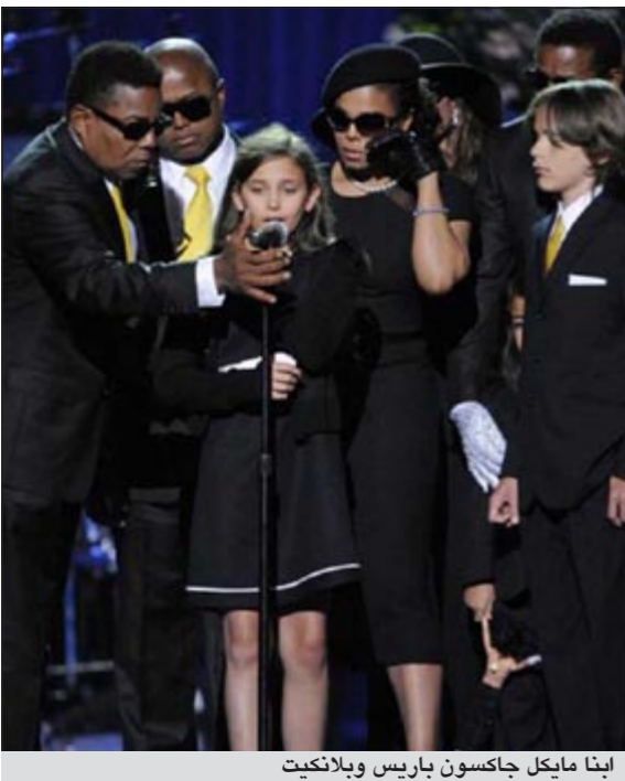
ابنا مايكل جاكسون باريس وبلانكيت

لوس أنجليس - يوبي.آي: قرر أولاد ملك البوب الأمريكي الراحل مايكل جاكسون حضور حفل يقام لتكريمه في ويلز ببريطانيا في أكتوبر المقبل خلافا لرغبة اثنين من أعمامهم.