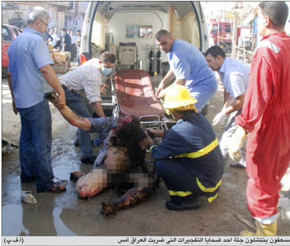
مسعفون ينقلون جثة أحد ضحايا التفجيرات التي ضربت العراق امس

المدن العراقية من وقوع هذا أعمال إرهابية متفرقة». وأضاف «الواقع بعد حالة الاسترخاء لدى القوات الأمنية حدث هذا الخرق الأمني ونحن في لجنة الأمن والدفاع سنستدعي كبار الضباط في الأجهزة الأمنية والجيش والشرطة لمناقشة تفاصيل هذه الخروقات وسنحاسب من ثبت تقصيره لأنه لا يمكن السكوت على مثل هذه الخروقات».