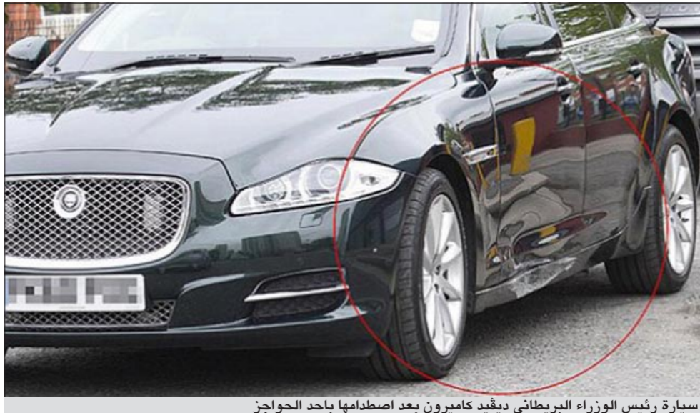
سيارة رئيس الوزراء البريطاني ديفيد كاميرون بعد اصطدامها باحد الحواجز

برمنغهام، وذلك في اعقاب عمليات النهب والعنف التي شهدتها المدينة مؤخرا. في هذا الوقت، قالت صحيفة «فايننشال تايمز» امس ان وزير المالية البريطاني جورج اوزبورن يسعى لحشد التأييد الدولي لموقفه الثابت بشأن خفض عجز الموازنة.