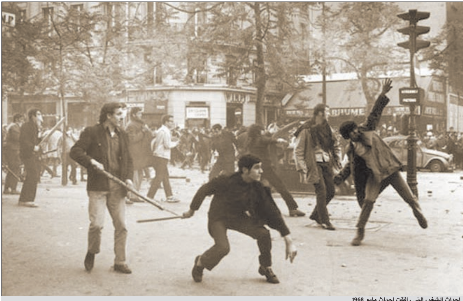
أحداث الشغب التي رافقت أحداث مايو 1968