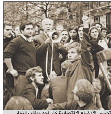
تحسين الأوضاع الاقتصادية كان أحد مطالب الثوار