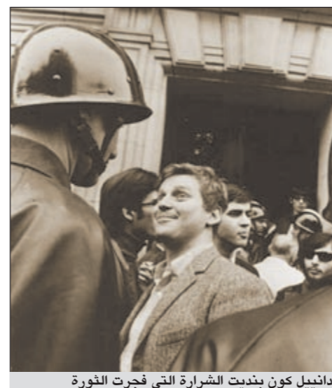
دانييل كون بنديت الشراة التي فجرت الثورة

تستلهم ثورات الربيع اليوم روح أحداث 1968 الشهيرة في فرنسا التي هزت أوروبا والعالم في حينه ولا تزال أصدائها تتردد إلى اليوم. لم تكن أحداث انتفاضة مايو ويونيو 1968 في فرنسا مجرد مرحلة تاريخية عابرة علا فيها صوت الشباب النائر ضد القيود التي تكبله فحطمها، بل كانت محطة مهمة و«انتفاضة» غيرت وجه البلد تماماً ولا تزال آثارها وتداعياتها ممتدة إلى اليوم، والدليل ما صرح به الرئيس الفرنسي نيكولا ساركوزي في بداية عهده عندما قال إن من أهدافه القضاء على ميراث حركة مايو 1968، لأنه – وكما كل اليمين في فرنسا – يعتبر أن تلك الحركة شكلت تهديداً للسلطة شوه المعايير السلوكية لدى المواطنين ودفعهم إلى الاستخفاف بقيمة العمل في الوقت الذي يراه فيه خصومهم النقطة التي سمحت بالتأسيس لفرنسا جديدة عنوانها الحرية والعدالة الاجتماعية.