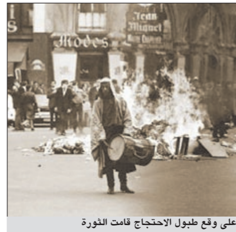
على وقع طبول الاحتجاج قامت الثورة