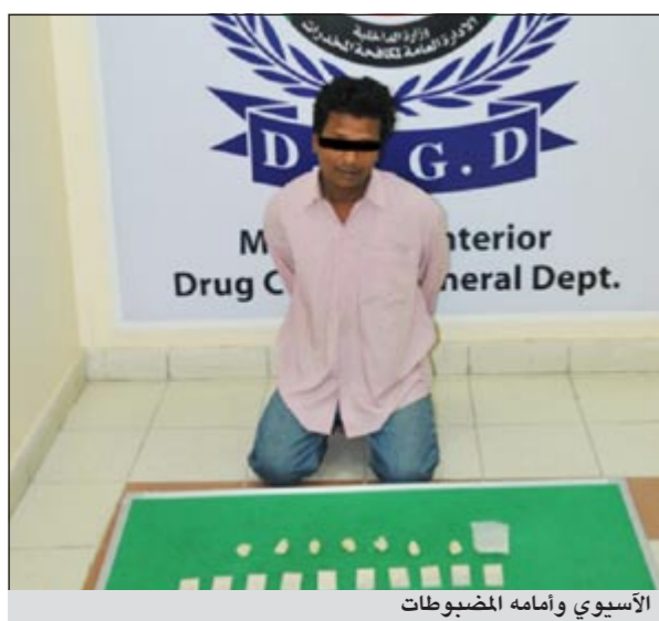
الأسوي و امامه المضبوطات

تمكن رجال الادارة العامة لمكافحة المخدرات - ادارة المعلومات - من القضاء القبض على وافد بنغالي وبحوزته 200 غرام هيروين و1000 حبة روش حيث وصلت معلومات الى وكيل وزارة الداخلية المساعد لشؤون الأمن الجنائي بالإنابة اللواء الشيخ احمد الخليفة تفيد عن قيام احد الوافدين بالتعاطي والاتجار في المواد المخدرة.