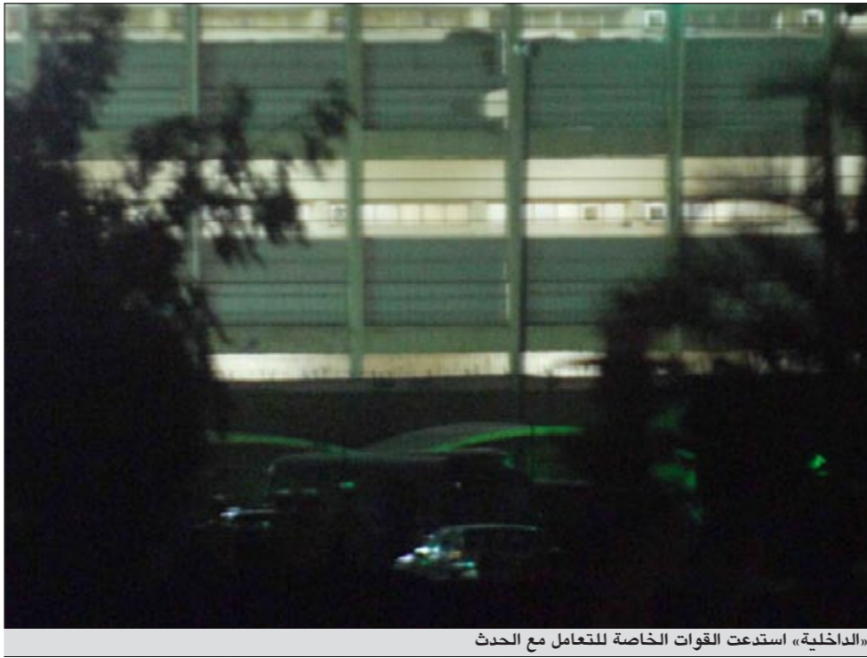
«الداخلية» استدعت القوات الخاصة للتعامل مع الحدث