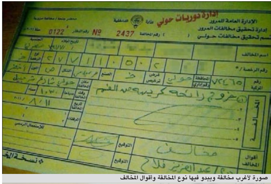
صورة لأعرب مخالفة ويبدو فيها نوع المخالفة وأقوال المخالف

أم إمكانية إجراء أمر صلح بشأنها، خاصة انه على ما يبدو ان رجل الأمن اشتد رائحة كريهة ولحقت به اضرار جسيمة! إجمالاً فقد تلتقت «الانباء» صورة مخالفة مرورية شديدة الغرابة تعلقت بهذا المسمى، أما الأعراب في هذه المخالفة فتتمثل فسي ان المخالف أقر في أقواله بان رائحة فمه كريهة.