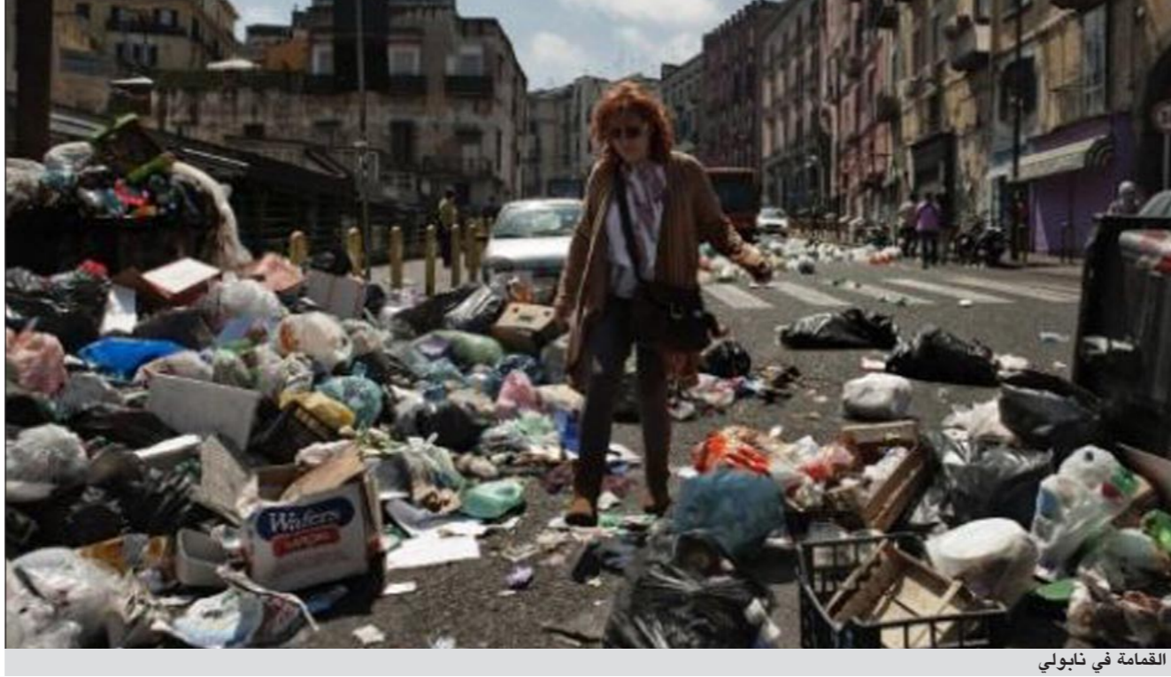
القمامة في نابولي

وأطلقت بيونسي ألبومها «أربعة» في يونيو الماضي حيث احتل المرتبة الأولى بين المبيعات لعدة أسابيع.