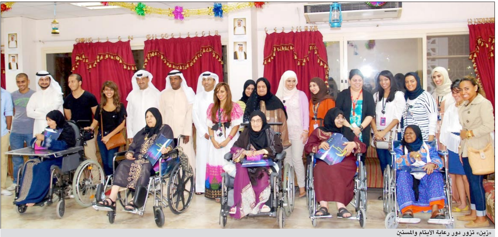
«زين» تزور دور رعاية الأيتام والمسنين

أرادت أن تشارك حالات اجتماعية هي بحاجة للمشاركة خلال شهر رمضان. وأضافت الشركة أنها لن تتوقف عن تنفيذ هذه البرامج، فهي أمامها جدول حافل بالزيارات لععدد كبير من دور الرعاية الاجتماعية والمستشفيات وذوي الاحتياجات الخاصة، مشيرة إلى أنها ما زالت ومن خلال فريقها التطوعي من موظفيها أمامها العديد من البرامج الاجتماعية التي أعدتها خصيصا لهذا الشهر.