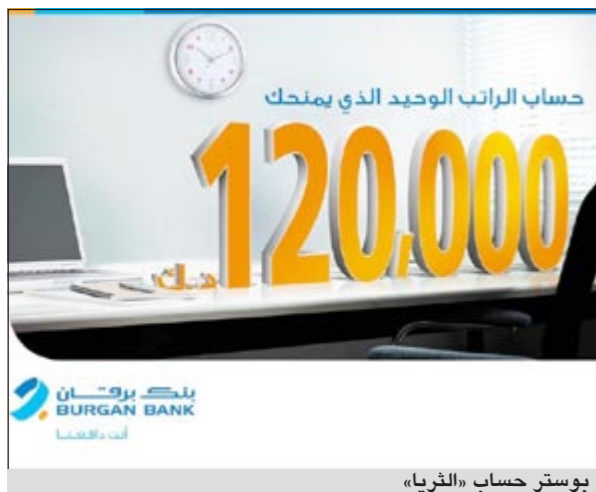
بوستر حساب «الثريا»

أعلن بنك برقان عن ابتكار وتطوير حساب الثريا الذي يقدم لعملائه مجموعة من الخدمات والحلول والمزايا المصرفية التي يعد بعضها فريدا في السوق المصرفي في الكويت. ويقدم حساب راتب الثريا من بنك برقان أكثر من مجرد خدمات مصرفية تقليدية، بل تتوسع خدماته ومزاياه لتشمل السحب الكبير الذي يقدم جائزة ضخمة تبلغ 120 ألف دينار تتوزع على راحين فقط، وهذه الإضافة الغنية والقيمة لحساب راتب الثريا تضمن لباقي المزايا والخدمات المصرفية ليكون هذا الحساب اختيارا ماليا بالمفاجآت القيمة.