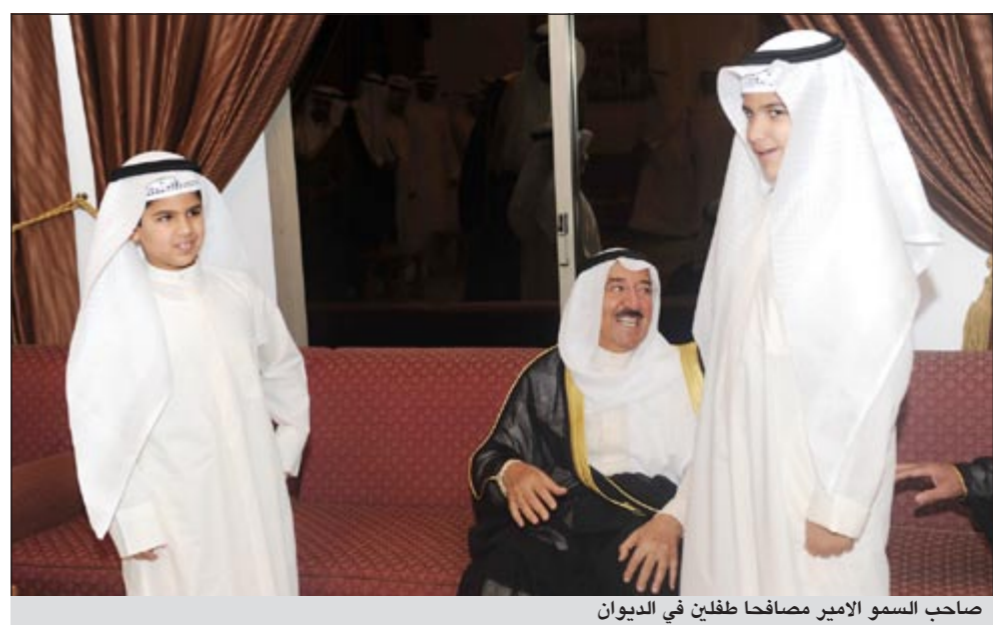
صاحب السمو الامير مصافحا طفلين في الديوان

قام صاحب السمو الامير الشيخ صباح الاحمد بزيارة ديوان الشيخ جابر الخالد وإخوانه برفقة سمو ولي العهد الشيخ نواف الاحمد ونائب رئيس الحرس الوطني الشيخ مشعل الاحمد ووزير الداخلية الشيخ احمد الحمود ووزير الديوان الاميري الشيخ ناصر صباح الاحمد والشيخ احمد الفهد وعدد من ابناء الاسرة، وذلك في اطار زيارات صاحب السمو للديوانيات لتقديم التهاني والتبريكات بشهر رمضان المبارك.