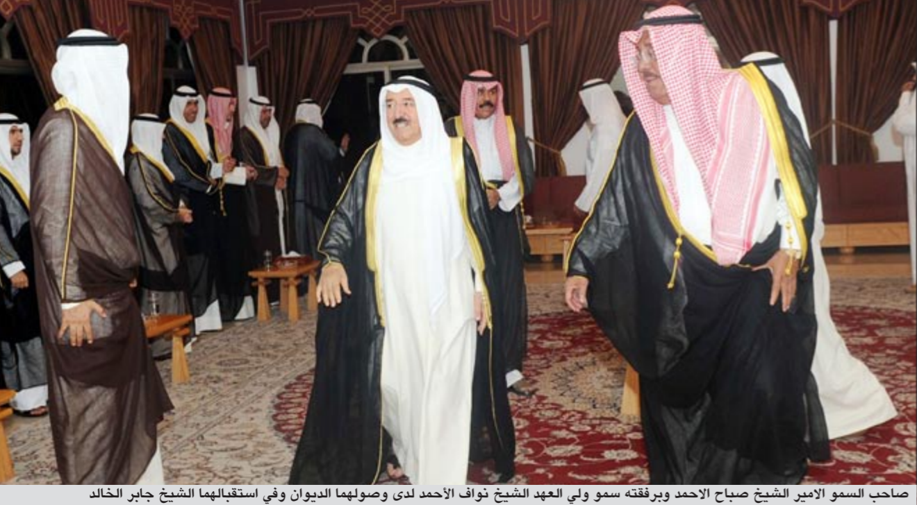
صاحب السمو الامير الشيخ صباح الاحمد ورفقته سمو ولي العهد الشيخ نواف الاحمد لدى وصولهما الديوان وفي استقبالهما الشيخ جابر الخالد

قام صاحب السمو الامير الشيخ صباح الاحمد بزيارة ديوان الشيخ جابر الخالد وإخوانه برفقة سمو ولي العهد الشيخ نواف الاحمد ونائب رئيس الحرس الوطني الشيخ مشعل الاحمد ووزير الداخلية الشيخ احمد الحمود ووزير الديوان الاميري الشيخ ناصر صباح الاحمد والشيخ احمد الفهد وعدد من ابناء الاسرة، وذلك في اطار زيارات صاحب السمو للديوانيات لتقديم التهاني والتبريكات بشهر رمضان المبارك.