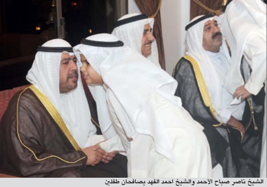
الشيخ ناصر صباح الاحمد والشيخ احمد الفهد يصفان طفلين