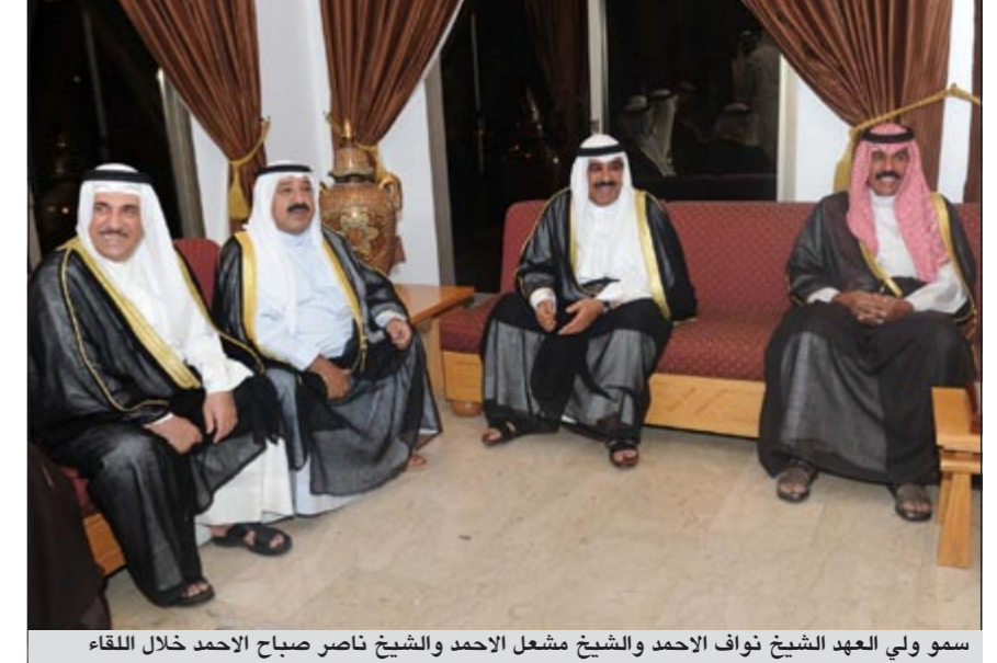
سمو ولي العهد الشيخ نواف الاحمد والشيخ مشعل الاحمد والشيخ ناصر صباح الاحمد خلال اللقاء