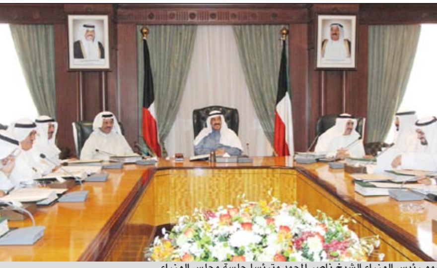
سمو رئيس الوزراء الشيخ ناصر احمد مترئسا جلسة مجلس الوزراء

عقد مجلس الوزراء اجتماعه الأسبوعي امس في قصر السيف برئاسة سمو رئيس مجلس الوزراء الشيخ ناصر احمد وبعد الاجتماع صرح نائب رئيس مجلس الوزراء ووزير الخارجية ووزير الدولة لشؤون مجلس الوزراء بالانابة الشيخ د.محمد الصباح بما يلي: في ضوء الاهتمام الذي يولييه مجلس الوزراء لمسألة قبول الطلاب في جامعة الكويت فقد استمع المجلس في مستهل اجتماعه الى شرح قدمه وزير التربية ووزير التعليم العالي احمد المليفي لما تم اتخاذه من خطوات جادة لضمان قبول أبنائنا وبناتنا الطلاب والطالبات في الجامعة وتمكينهم من الالتحاق بها وفي هذا الصدد فقد وافق المجلس على تخصيص المبالغ المالية اللازمة لمواجهة تكاليف ابتعاث الطلاب ممن لم يتم قبولهم في الجامعات الخاصة والبعثات الخارجية. وقد أشاد المجلس بالخطوات التي تم اتخاذهما في مواجهة مشكلة القبول في الجامعة، مؤكداً أن تسليح أبنائنا وبناتنا الطلاب والطالبات بالعلم وتأهيلهم لبناء وطنهم يمثل أولوية مهمة ولن يدخر جهداً أو مالا