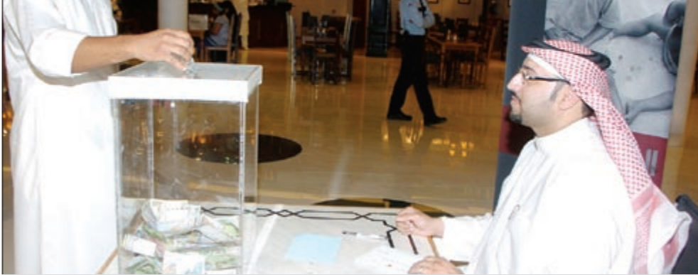
بحريني يتبرع بالمال لإغاثة منكوبي الصومال

وإضافة «قرارنا حاسم لا تراجع عنه. لن نشارك في هذا البرلمان». في هذا الوقت اعتبر وزير العدل والأوقاف والشؤون الإسلامية الشيخ خالد بن علي آل خليفة أن إجراء الانتخابات التكميلية يعد ما شهدته المملكة من أحداث يؤكد أن مسيرة الإصلاح والديموقراطية في مملكة البحرين ماضية بكل عزم وثبات وأنه لا عودة إلى الوراء. وقال في مقابلة خاصة مع وكالة أنباء البحرين إن عجلة هذه المسيرة المباركة التي انطلقت مع الإجماع الوطني التاريخي على ميثاق العمل