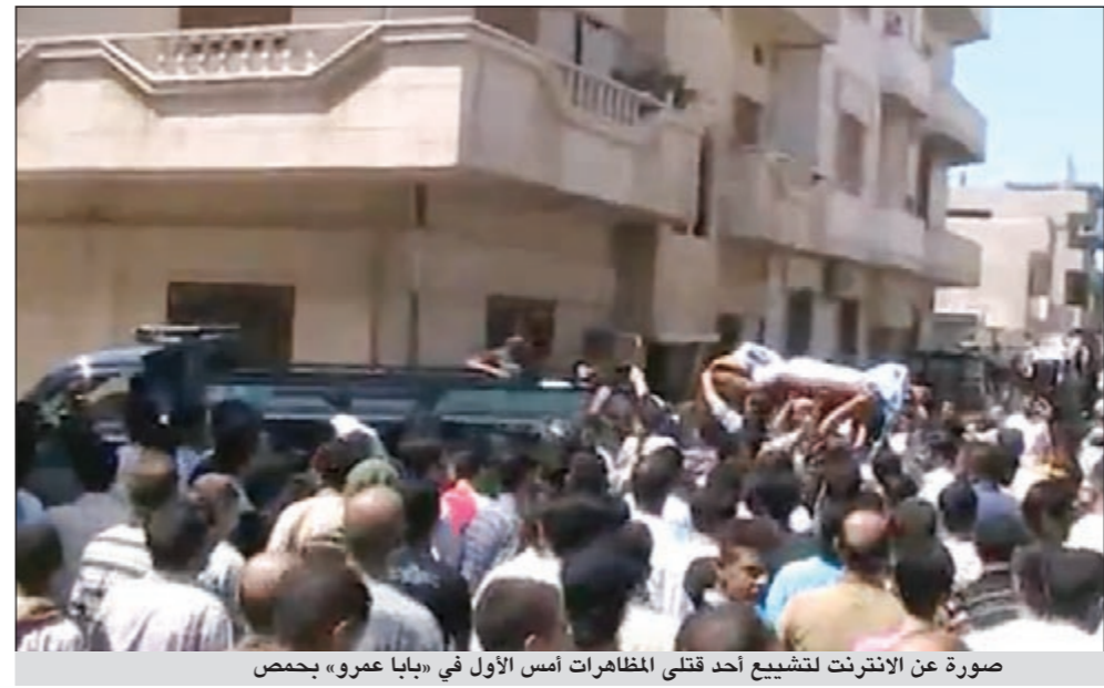
صورة عن الإنترنت لتشييع أحد قتلى المظاهرات أمس الأول في «باب عمرو» بحمص