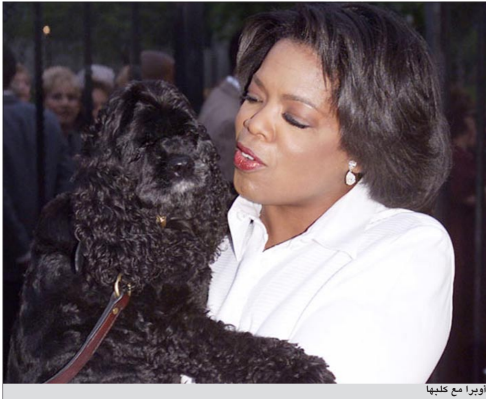
أوبرا مع كلبها

أما الكلب ترابل فورث هذا الكلب في عام 2007 ثروة تقدر بـ 7.2 ملايين دولار، ويعتبر من بين أغني الكلاب في ولاية نيويورك الأمريكية.