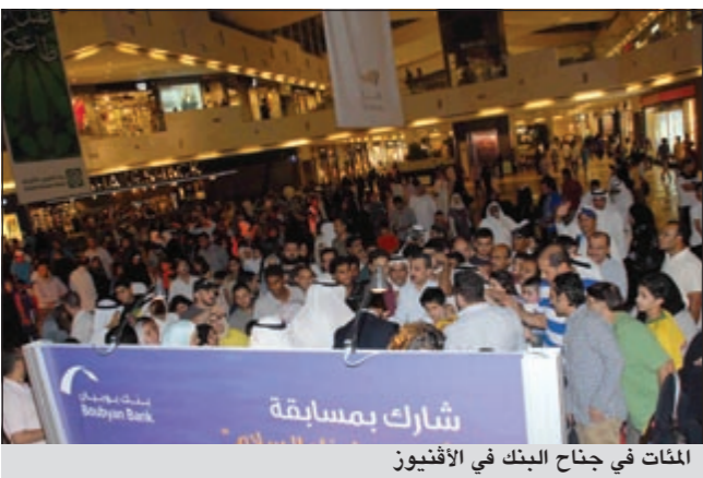
المئات في جناح البنك في الأقبوز

احتفل بنك بويان مع الآلاف من زوار مجمع الأقبوز في عطلة نهاية الأسبوع بوحدة من اهم المناسبات الاجتماعية التي ارتبطت بالشهر الكريم وهي القرقيعان كما قام بإطلاق مسابقة القرقيعان «انعم علينا بالسلام» بين الجمهور وذلك في أجواء اجتماعية رائعة ميزت جناح البنك في المجمع.