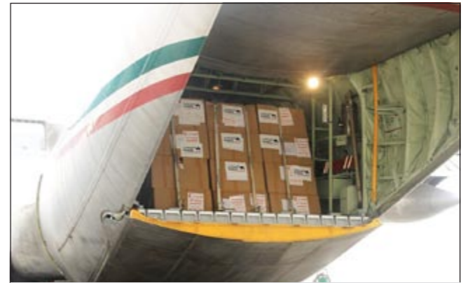
طائرة مساعدات الوطني المتجهة إلى الصومال