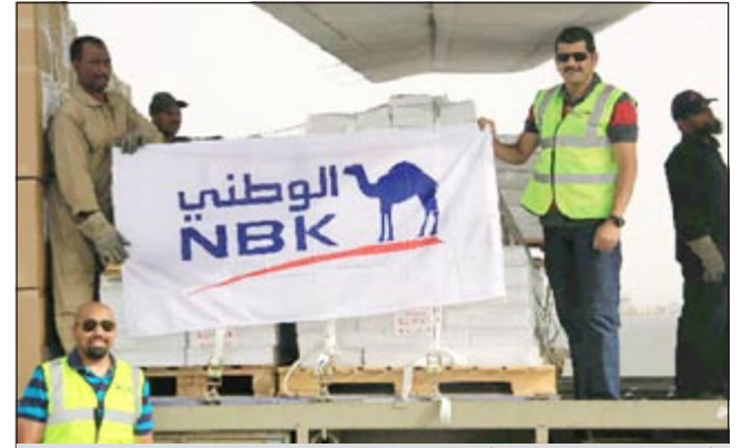
فريق المتطوعين من موظفي «الوطني»

أعلن بنك الكويت الوطني عن مساهمته في إرسال أول طائرة