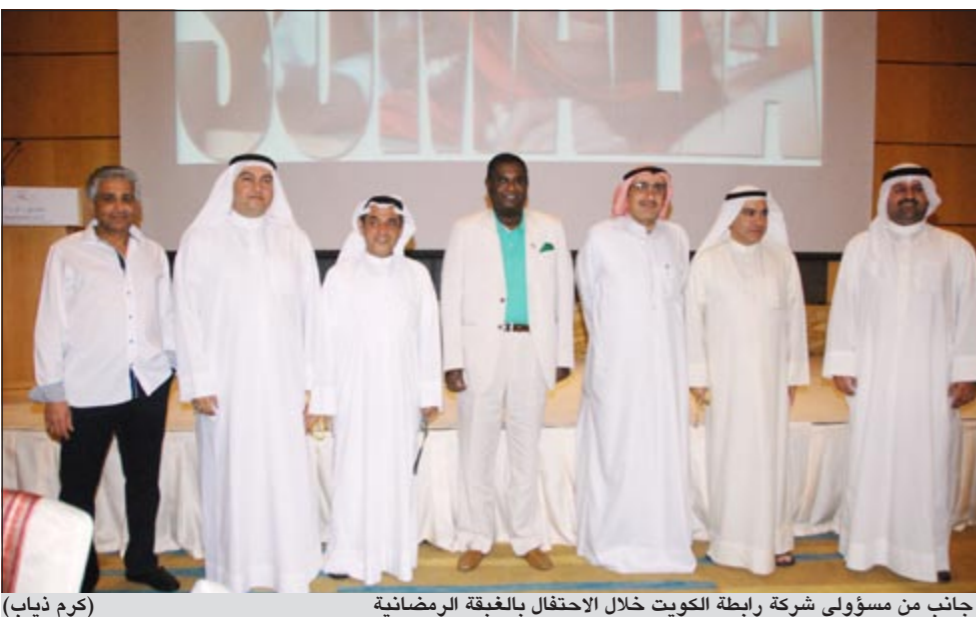
جانب من مسؤولي شركة رابطة الكويت خلال الاحتفال بالغبقة الرمضانية

وأصبحوا على شفير المجاعة، كما جرى تقديم سيارة جديدة وبعض قسائم الهدايا في مزاد لجمع الأموال من أجل الصومال. حيث شارك موظفو الشركة في هذا المزاد الخيري باعتباره جزءا من حملة «دعونا نساعد الصومال» التي أطلقتها الشركة في هذا الشهر الفضيل بالتنسيق مع جمعية الهلال الأحمر الكويتي، وسيتم تسليم عائدات هذا المزاد الخيري إلى جمعية الهلال الأحمر الكويتي ك تبرعات للصومال. تجدر الإشارة إلى أن هذا المبادرة جاءت انطلاقا من مبدأ المسؤولية الاجتماعية وتماشيا مع نهج شركة رابطة الكويت والخليج القابضة في تقديم المساعدات الإنسانية للمتضررين من الكوارث الطبيعية والكوارث الإنسانية الأخرى. ● محمد فاروق