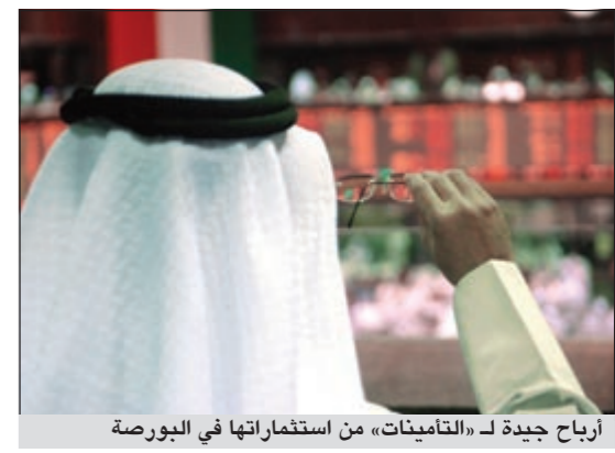
أرباح جيدة لـ «التأمينات» من استثمارات في البورصة

استطاعت المؤسسة العامة للتأمينات في السنة المالية 2011/2012 أن تحقق خلال السنة المالية الحالية صافي أرباح بحوالي 2,07 مليار دينار بنمو 35٪ مقارنة بالأرباح المعتمدة للسنة المالية الماضية 2010/2011 والبالغة 1,49 مليار دينار وبتزايد قدرها 530 مليون دينار. وعززت الإيرادات المتدفقة