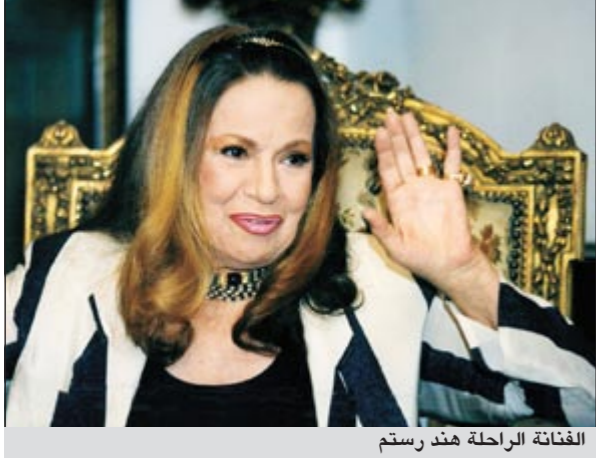
الفنانة الراحلة هند رستم

وأوضحت أن وفاتها جاءت بشكل مفاجئ وسريع، إذ نقلت إلى المستشفى بعد ارتفاع درجة حرارتها، وبعد إجراء الفحوصات الطبية، طمأنها الأطباء، حتى أنه كان يفترض أن تغادر المستشفى