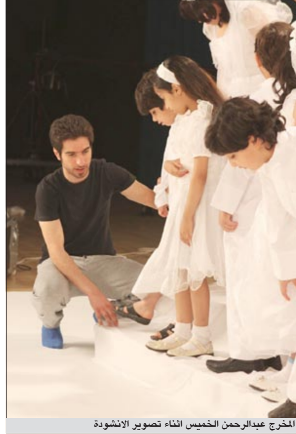
المخرج عبدالرحمن الخميس اثناء تصوير الأشرطة

تعاونت مع سلطان الرومانسية عبدالله الرويشد من خلال تضييحه لصور اليومه الأخير «ليلة عمر»، وشاركت أيضا في مسلسل النجم عبدالعزيز المسلم «البيت المسكون» الذي عرض في رمضان الماضي، وأيضا أنجزت فيديو كليب لشركة «زين» للاتصالات وكان من غناء نجم «ستار أكاديمي» الفنان احمد حسن عن المنتخب الوطني، كما أخرجت بعض الاعلانات، متمنيا أن يقدم كل ما ينال رضا الجمهور. من جانبه، عثر مدير عام الشؤون الإدارية في بنك