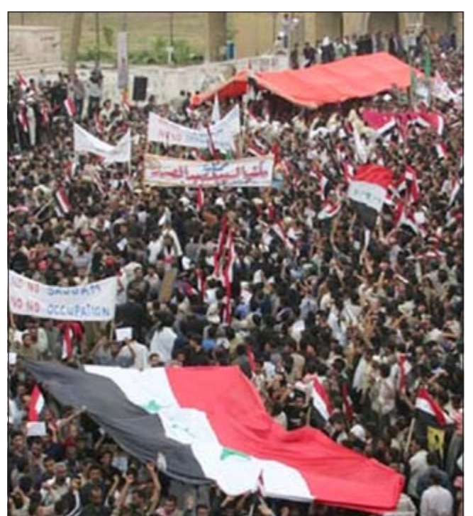
جانب من المظاهرات العراقية المطالبة بإيقاف بناء الميناء