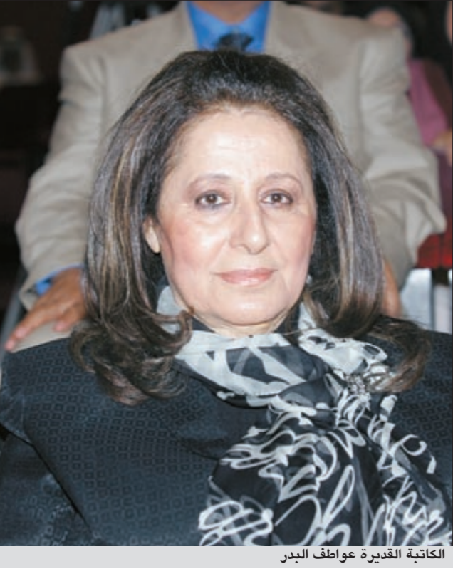
الكاتبة القديرة عواطف البدر