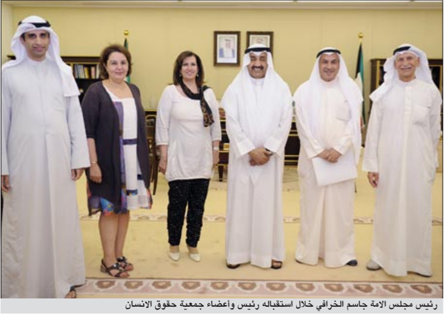
رئيس مجلس الأمة جاسم الخرافي خلال استقباله رئيس وأعضاء جمعية حقوق الإنسان

مجلس إدارة الجمعية. وبعث رئيس مجلس الأمة جاسم محمد الخرافي برقية تهنئة إلى رئيس الجمعية الوطنية في جمهورية تشاد هارون كبادي، وذلك بمناسبة العيد الوطني لبلاده.