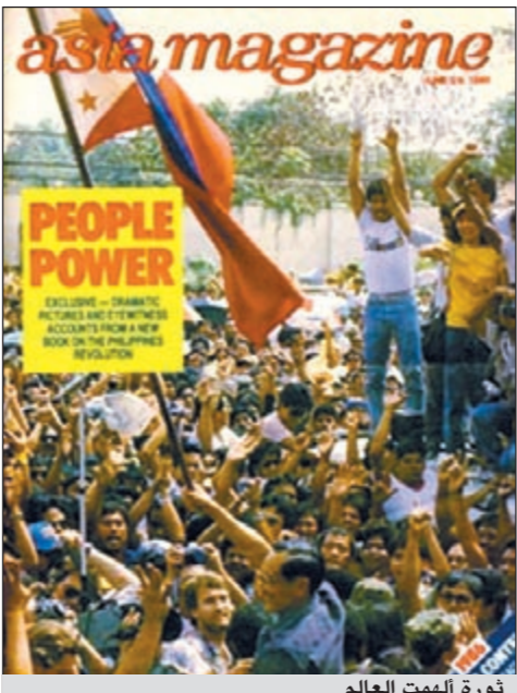
ثورة ألهمت العالم

تشكل كل من ثوري «قوة الشعب» الأولى المعروفة بالثورة الصفراء والثانية محطتين مهمتين ضمن حركات النضال الشعبي في القرن العشرين سواء الانظمة التوتاليتارية او الفاسدة وقد افضت كل من الثورتين السلمييتين المذكورتين الى تغيير الرئاسة في بلد مهم في جنوب شرق آسيا هو الفلبين، ارجيل الجزر الذي يقطنه اليوم نحو 94 مليون نسمة وأحدثنا تأثيراً واضحاً في أسلوب الثورات المشابهة التي تلت كلا منهما..