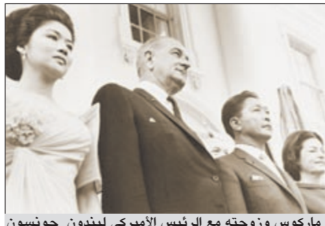
ماركوس وزوجته مع الرئيس الأميركي ليندون جونسون وزوجته في البيت الأبيض عام 1966

بمناسبة ما أطلق عليه «الربيع العربي» نستعيد بالذاكرة بعض الثورات المشابهة في أوروبا والعالم خلال العقود الماضية منها الثورة المخملية في تشيكوسلوفاكيا والثورة الوردية في جورجيا والبرتغالية في أوكرانيا وثورة التوليب في قيرغيزيا وثورة البلدوزر في صربيا وثورة الغناء في دول البلطيق، إضافة إلى بعض تجارب القرن الماضي في مجال النضال السلمي للحركات التحررية وصولاً إلى الثورات العربية.