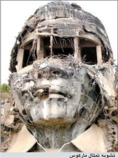
تشويه تمثال ماركوس