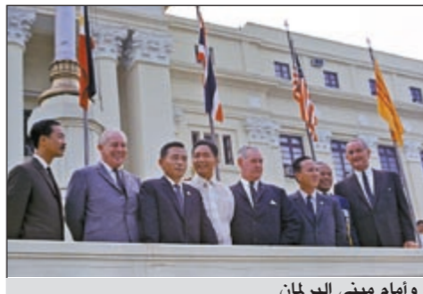
وامام مبنى البرلمان