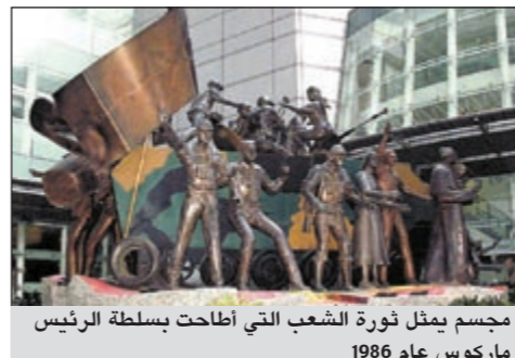
مجلس يمثل ثورة الشعب التي اطاحت بسلطة الرئيس ماركوس عام 1986