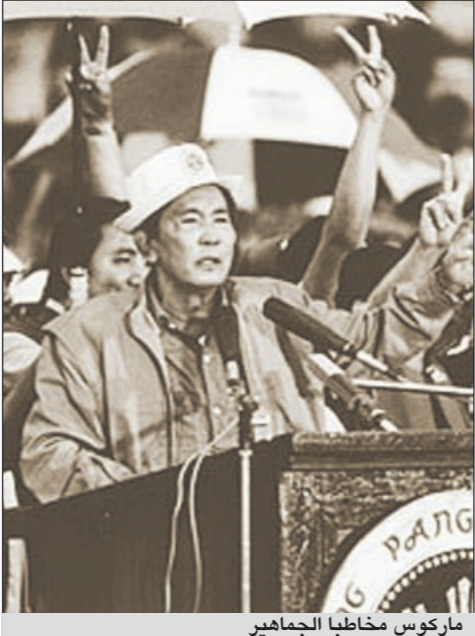
ماركوس مخاطباً الجماهير

ومع انتهاء فرز الأصوات أعلن كل من الطرفين فوز: ماركوس استند إلى لجنة الانتخابات الرسمية