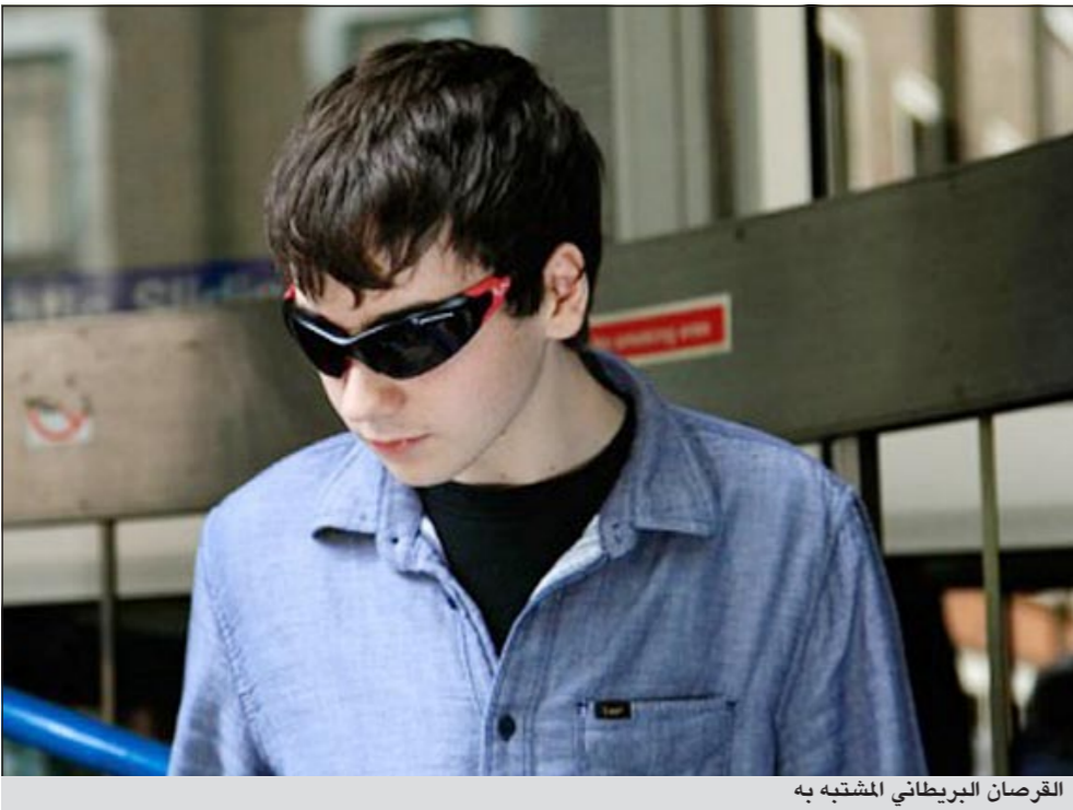
القرصان البريطاني المشتبه به

احد هذه الملفات، تحت عنوان «تقرير الوشاية والإبلاغ عن الجريمة»، يحتوي على العشرات من عمليات الإبلاغ عن معلومات حول الحوادث المحلية من قبل المواطنين، وبعضها يتضمن عناوين وأسماء الأشخاص المبلغين. وكان العديد من المخبرين والمبلغين اشترطوا الإبقاء على سرية اسمائهم ومعلوماتهم الشخصية، خوفاً من الانتقام أو التعرض للأذى. في البيان المرفق للملفات التي تم تسريبها، قال القرصنة: «ليس لدينا أي تعاطف مع أي من الضباط أو المخبرين الذين قد يكونون عرضة للخطر بسبب نشر المعلومات الشخصية الخاصة بهم». وأضافوا أنهم سينشرون «كميات هائلة من المعلومات السرية التي من المؤكد أنها ستحرج وتشوه سمعة ضباط الشرطة في مختلف أنحاء الولايات المتحدة». خلال شهر يوليو الماضي، قام ضباط من مكتب التحقيقات الفيدرالي والشرطة البريطانية والهولندية باعتقال 21 شخصاً بتهمة القرصنة. وتعتقد الشرطة أن المتهمين مرتبطين بعملية القرصنة التي طالت موقع «باي بال»، لخدمة الدفع عبر الإنترنت، والذي استهدف بعد أن رفض تنفيذ عمليات نقل الأموال لـ «ويكليكس»، المجموعة المناهضة للسرية والمسؤولة عن تسريب وثائق حكومية سرية.