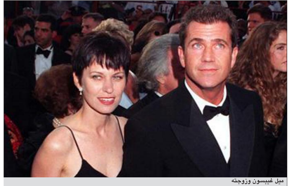
ميل غيبسون وزوجته

وقال غيبسون «نحن كلنا منخرطون بحياة جوزي وتيريزا»، وأضاف «من الرائع رؤيتهما بصحة جيدة وعند سماع جوزي تتكلم نطقن أن هذه أسعد طفلة تراها يوماً». ووصل غيبسون وزوجته السابقة منفصلين ورافقهما ثلاثة من أولادها وثلاثة من أحفادها. وكانت روبين تترأس في السابق جمعية «منديغ كيدز انترناشيونال» التي نظمت الحفل.