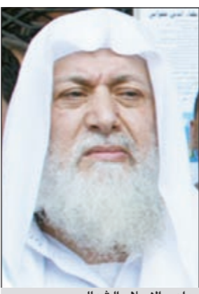
داعي الإسلام الشهاب

وفي موقف لافت سبق جميع المواقف اللبنانية المؤيدة للانتفاضة في سورية، دعا الشهاب الجيش السوري لضباط ورتباء وافراداً من جميع الطوائف والمذاهب السورية الى الانشقاق عن صفوف النظام والالتحاق بصفوف المعارضة لدعم خطواتها الوطنية في