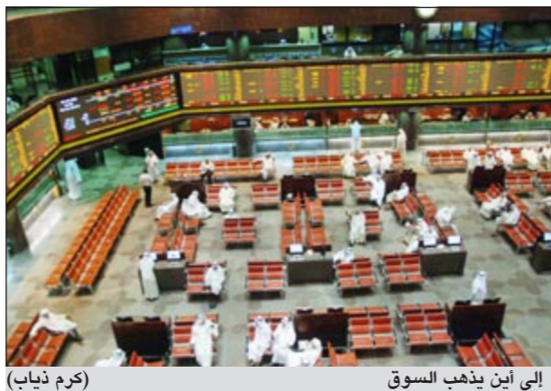
إلى أين يذهب السوق (كرم ذياب)

واصل سوق الكويت للاوراق المالية تراجعاته التي بدأها منذ بداية تعاملات الاسيوع الجاري تفاعلا مع تداعيات الأحداث الاقتصادية العالمية والتي من أبرزها تخفيض التصنيف الائتماني للولايات المتحدة عن بؤادر أزمة مالية جديدة في الدول الآسيوية بدأت تلوح في الأفق.