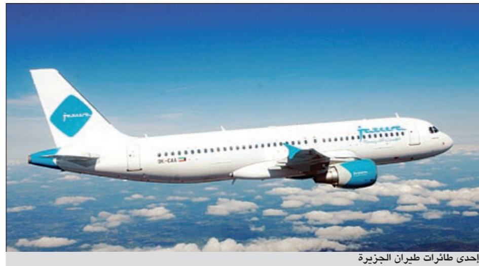
إحدى طائرات طيران الجزيرة

وعلى صعيد النتائج الرئيسية في النصف الأول من 2011، بينت المجموعة أن الإيرادات التشغيلية بلغت 25,3 مليون دينار، وهي زيادة بنسبة 41,9٪ عن الفترة ذاتها من العام الماضي، وبلغت الأرباح التشغيلية 4,6 ملايين دينار،