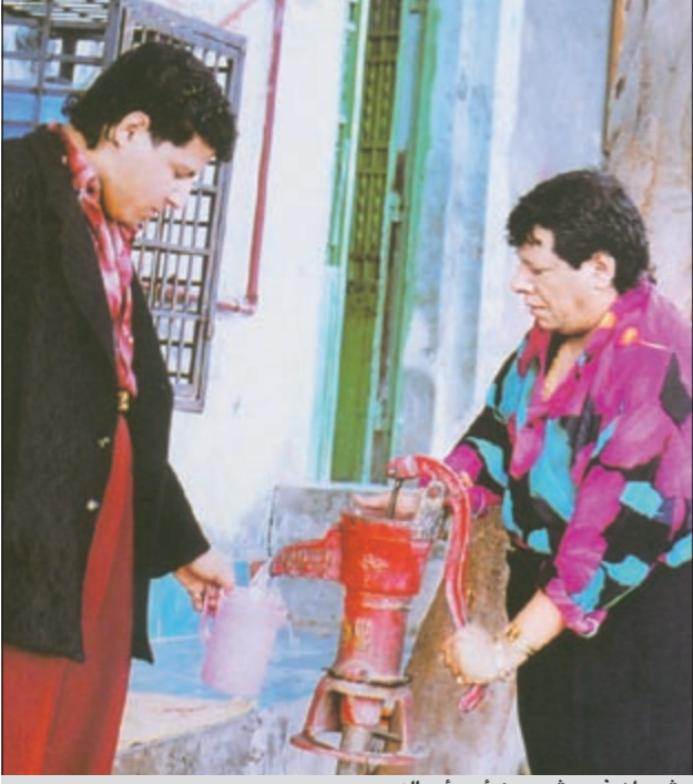
شعبان في مشهد من أحد أعماله

زاوية تسلط الضوء فيها على أهم الشوارع التي لا تزال في مخيلة الفنانين والإعلاميين ويترددون عليها في شهر رمضان.