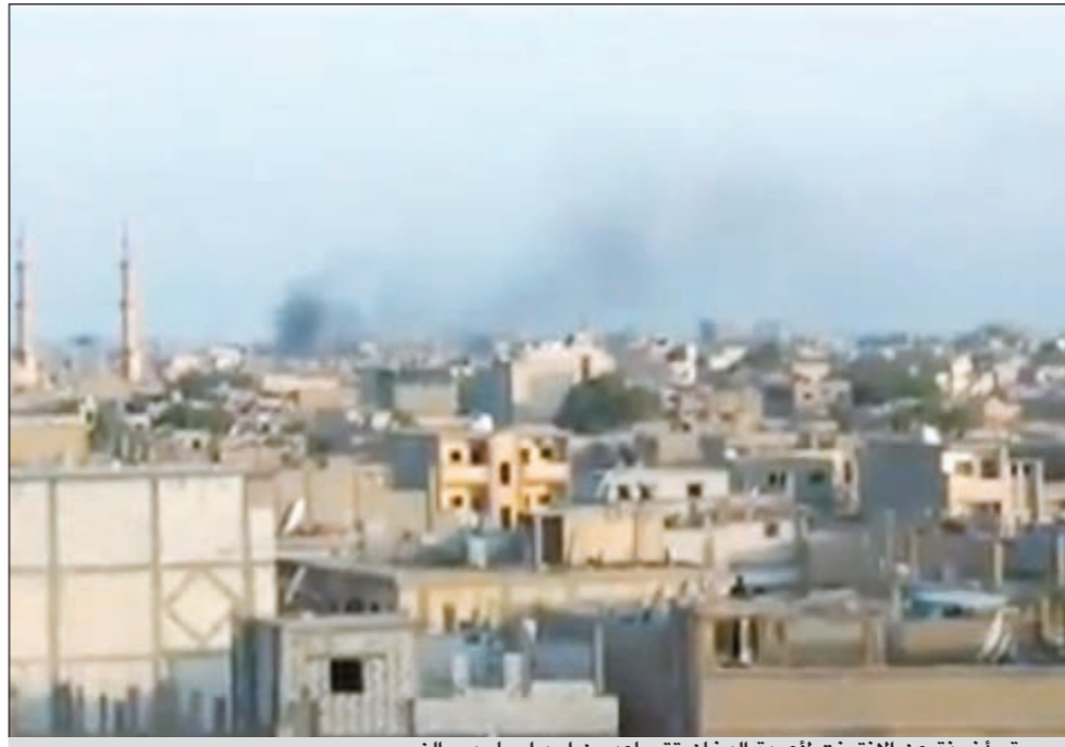
صورة مأخوذة عن الانترنت لأعمدة الدخان تتصاعد من احد احياء دير الزور

وقالت لجان التنسيق المحلية إن عشرات الدبابات والمدافع والحافلات التي تقل رجال الأمن