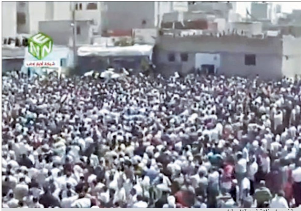
..وأخرى لجنائز أحد قتلى ادلب

كما أشار المرصد الى ان السلطات قطعت الكهرباء أيضاً عن مدينة بنش الواقعة كذلك في ادلب، مؤكداً ان قطع التيار الكهربائي لم يحل دون استمرار تظاهرة خرجت بعد صلاة التراويح للمتطالبة بإسقاط النظام.