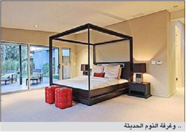
.. و غرفة النوم الحديثة

تخلت النجمة الأميركية الشابة مايلي سايروس عن منزلها قرب حبيبتها السابق نيك جوناس لتنتقل الى منزل جديد دفعت مقابله 3,9 ملايين دولار. واشترت سايروس (18 عاما)