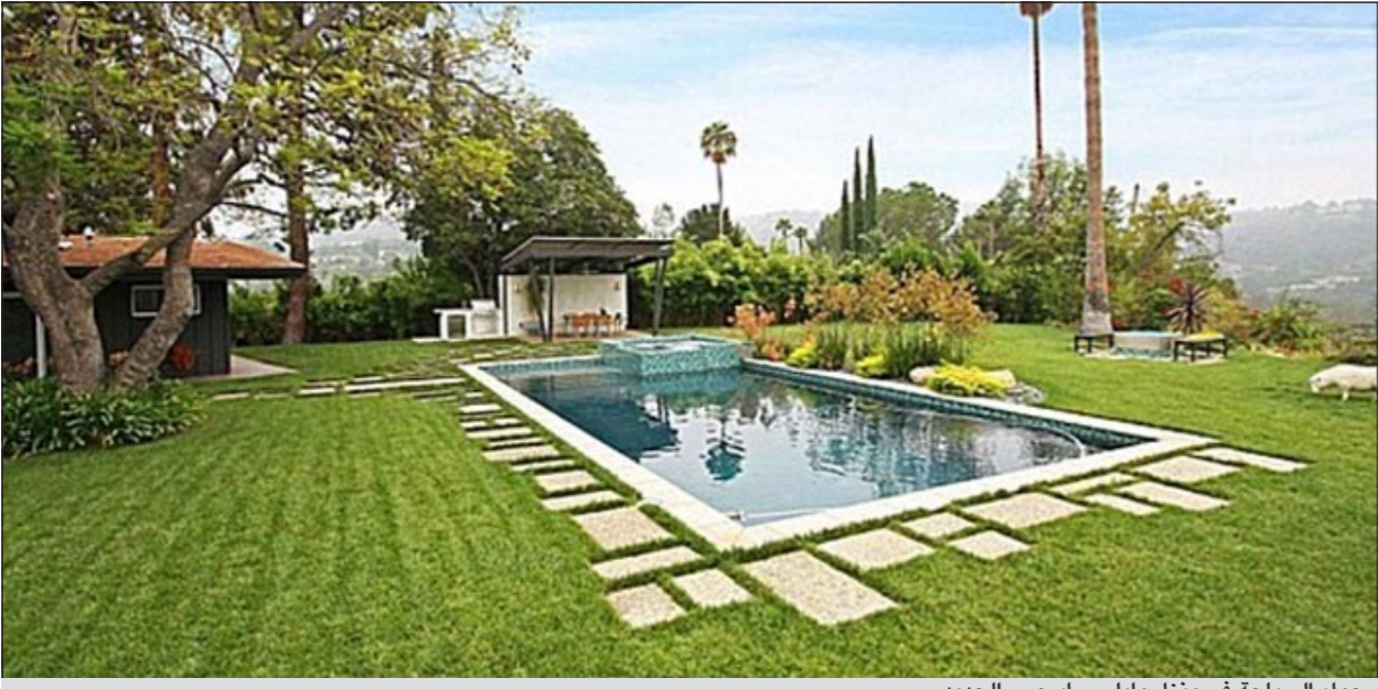
حمام السباحة في منزل مايلي سايروس الجديد

بتماشى مع نوقها الفريد والغريب. المنزل الجديد قريب من منزل تولوكا لايب مقابل 3,4 ملايين دولار، ونقل عن مصدر مقرب من سايروس قوله أنها انتقلت الى المنزل الجديد وزينته بما