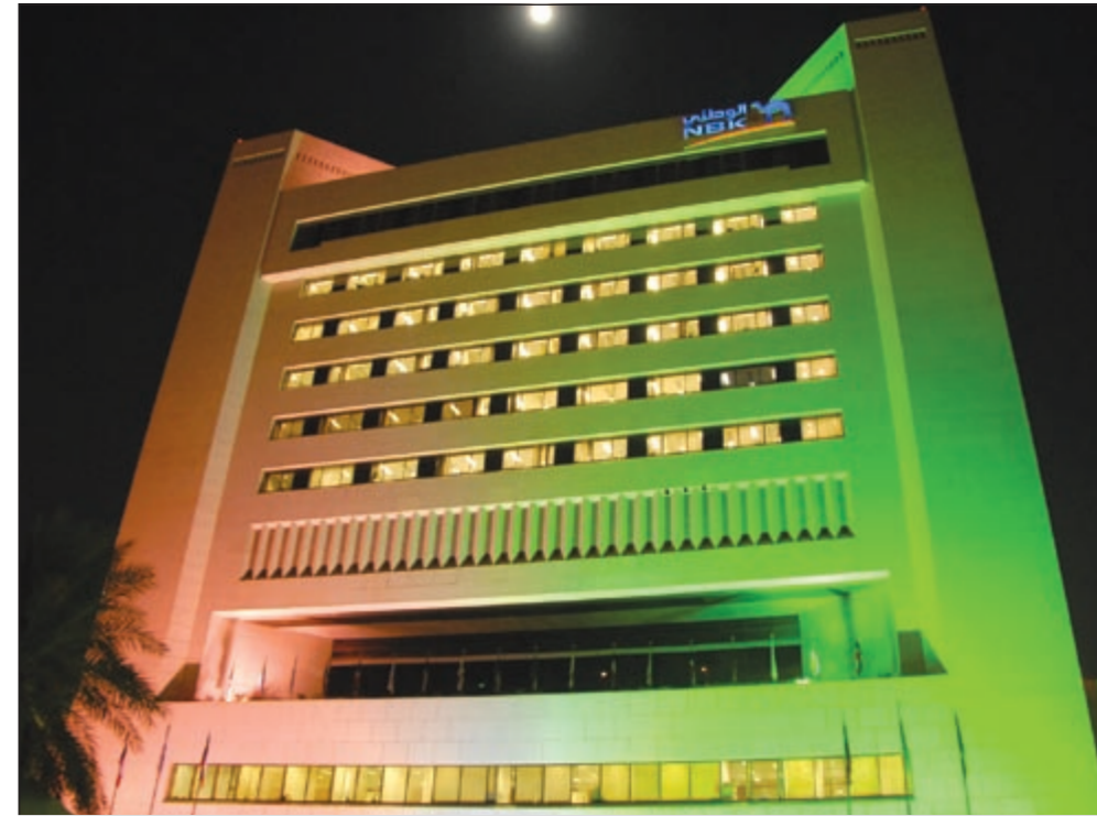
«الوطني» يتمتع بقدرة على هيكلة وتمويل التحويلات الضخمة في أسواق رأس المال

كما يستحوذ الوطني على الحصة الأكبر في سوق خدمات التجزئة، والخدمات المصرفية للشركات. وأوضحت أن «كافة العقود الكبيرة الممنوحة إلى الشركات الأجنبية تقريباً يقودها بنك الكويت الوطني عملية تمويلها، كما أنه أكبر بنك في تمويل التجارة في الكويت».