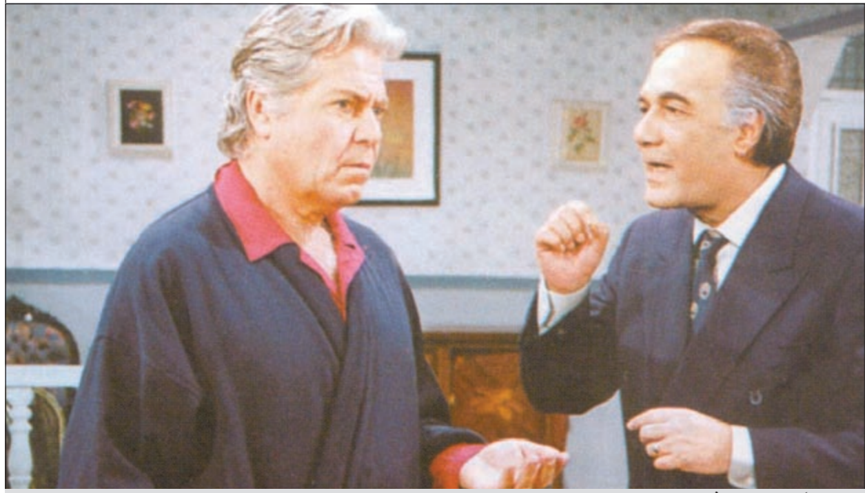
محمود ياسين مع حسين فهمي