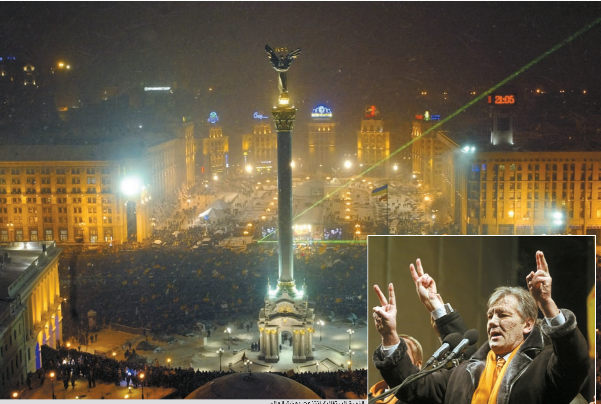
الثورة البرتقالية انتزعت دهشة العالم

انتخب ليونيد كوتشما ثاني رئيس لأوكرانيا بعد استقلالها عن الاتحاد السوفييتي خلال انقراضه. حكم بلاده لولايتين بين 19 يوليو 1994 و23 يناير 2005. وقد هُزت ولايته الثانية فضيحة كبيرة عندما سرب رئيس الحزب الاشتراكي الأوكراني الكسندر موروز تسجيلاً له يتحدث فيه عن احتمال اغتيال الصحافي غريغوري غونغاذه الذي اختفى عام 2000 في ظروف غامضة ثم عثر على جثته مقطوعة الرأس.