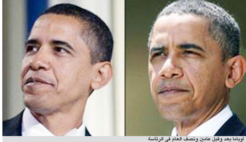
أوباما بعد وقبل عامين ونصف العام في الرئاسة

وقالت إحدى القناتيات إن الدعوة وجهت على الإنترنت للمجيء إلى الحديقة العامة واللعب بالماء. وأشار صبي إلى أن الاختلاط «كان حميمياً أكثر مما ينبغي». وقال رئيس شرطة الآداب في طهران أحمد روزبهاني «إن فعالية مختلطة جرت يوم الجمعة» وطلب من المشاركين «أن يجلبوا مسدسات ماء حملها غالبيتهم بأيديهم... وتصرفوا على الضد من قواعد السلوك الاجتماعي».