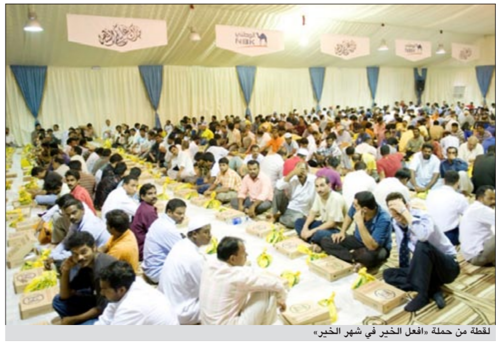
لقطة من حملة «افعل الخير في شهر الخير»