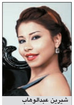
شيرين عبد الوهاب

وفي المقابل، عذرت شيرين رفيق مسيرتها تامر حسني في موقفه الأول من الثورة، مؤكدة رفضها لـ «قوائم العار» لأن أغلب من فيها لم يفهموا فعلاً ما يحدث، ومن ضمنهم تامر الذي أعلن بعد ذلك مساندته للثورة عند فهمه للأمر، ومن المهم أن نتسامح معه لأنه ليس «مواطناً إسرائيلياً» حتى ننكره.