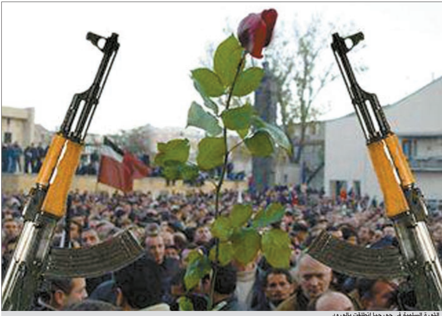
الثورة السلمية في جورجيا انطلقت بالورود