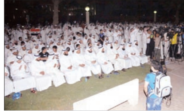
جانب من الاعتصام التضامني مع الشعب السوري في ساحة الإرادة مساء أمس الأول (التفاصيل ص 9)