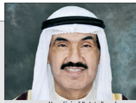
سمو رئيس الوزراء الشيخ ناصر المحمد