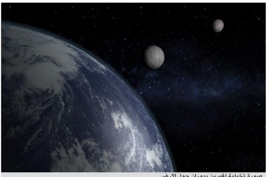
صورة تخيلية لقمرين يدوران حول الأرض

سانتا كروز - يو.بي.أي: رجح باحث أميركي انه كان لكوكب الأرض من قبل قمران اصطدما ببعضهما وإذ بالقمر المرافق لنا الآن يتميز بشكل غير متناسق ترك العلماء بحالة من الدهول لفترة طويلة. وكتب العالم المتخصص في شؤون الكواكب بجامعة كاليفورنيا إيريك أسبوهو مقالة في مجلة «نايتشر» الأميركية قال فيها إن المرجح أن قمرين كانا يدوران حول كوكب الأرض واصطدما بونيعة بطيئة دامت عدة ساعات ما خلق اختلافا غريبا بين الجهة المرئية لنا من القمر الحالي والجهة الخلفية