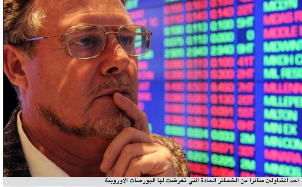
أحد المتداولين متائرا من الخسائر الحادة التي تعرضت لها البورصات الأوروبية

عواصم - وكالات: واصل المستثمرون عمليات بيع كثيفة للأسهم في البورصات العالمية أمس لليوم الثامن على التوالي حيث تراجعت الأسهم الأوروبية متأثرة بموجة انخفاض الأسهم في بورصات آسيا ونيويورك ما دفع حملة الأسهم إلى التفكير في البحث عن استثمارات آمنة.