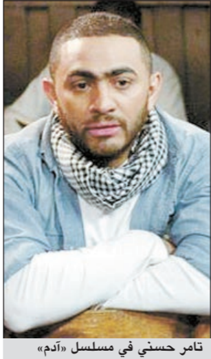
تامر حسني في مسلسل «أدم»

من المحطات الفضائية التي تعرض مسلسلاً «أدم» الذي يقوم ببطولته الفنان المصري تامر حسني قساة «النهار» المصرية، وقد أعلنت القناة، حسب ما ذكر موقع «النشرة»، أنها تلقت أكثر من 5000 رسالة من أجل إعادة الحلقة الثانية من المسلسل.