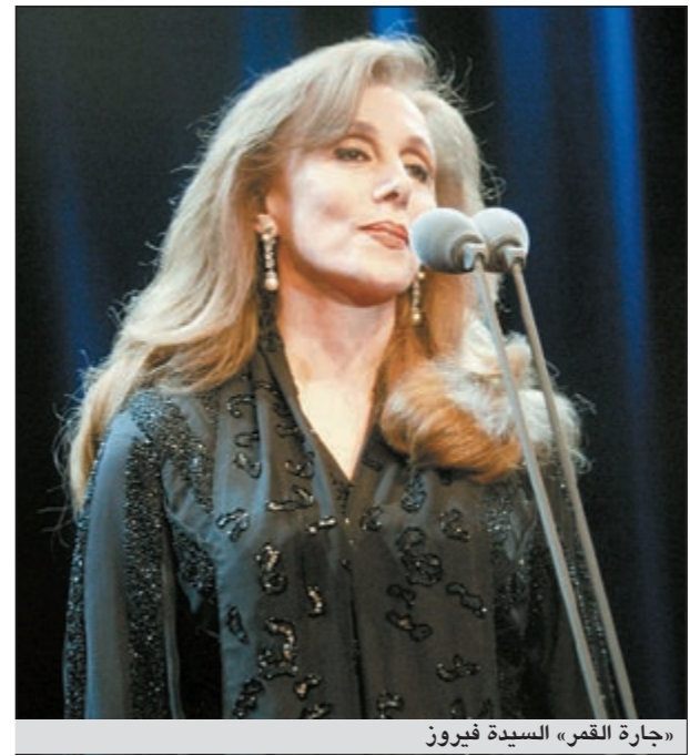
«جارة القمر» السيدة فيروز

ولم يشر البيان إلى أي نزاع قانوني بين الشركة والأنسة ريمسا الرحباني ووالدها السيدة فيروز، خاصة أن الأنسة ريمسا الرحباني كانت أكدت في اتصال مع «الأنباء» أنها كانت ادعت على الشركة لإيقاف العمل في حال تبين أنه يتناول سيرة والديها.