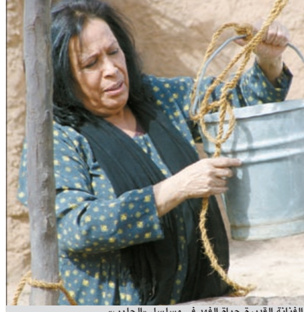
الفنانة القديرة حياة الفهد في مسلسل «الجليب»