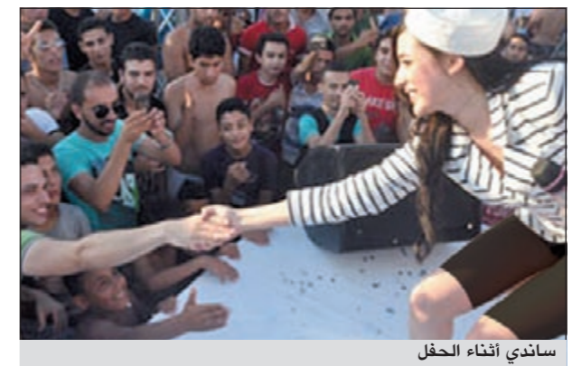
ساندي أثناء الحفل

أم.بي.سي: ذكرت تقارير صحافية أن المطربة ساندي التي ارتدت «شورت» مثيراً لجح من تحرش جنسي لأحد المعجبين أثناء إحيائها حفلة في منطقة العجمي بالإسكندرية. وكانت ساندي قد مدت يدها لتسلم على أحد المعجبين الواقف تحت المسرح مباشرة، لتفاجأ به بجذبها من يدها محاولاً التحرش بها، وإنزالها عن المسرح، فتدخل الحراس الموجودون وانقذوها بحسب مجلة «لها» الصادرة هذا الأسبوع. وصعدت ساندي إلى خشبة المسرح مرتدية ملابس مثيرة للجدل، وغنت أكثر من ساعة ونصف مجموعة كبيرة