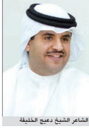
الشاعر الشيخ دعيج الخليفة

يشرف الشاعر الشيخ دعيج الخليفة على حفل الإفطار السنوي الذي يقمه الفنان حسن عسيري غدا (السبت) بمدينة جدة وذلك بحضور أبطال أحدث مسلسلات العسيري المسلسل الكوميدي «قول في الثمانينات» ويعرض عبر القناة السعودية الأولى، ووجهت الدعوة لمجموعة من الشخصيات الفنية والإعلامية إلى جانب عدد من وجهاء المجتمع السعودي والعربي لتناول الإفطار ومشاركة الشركة احتفالها بال شهر الفضيل.